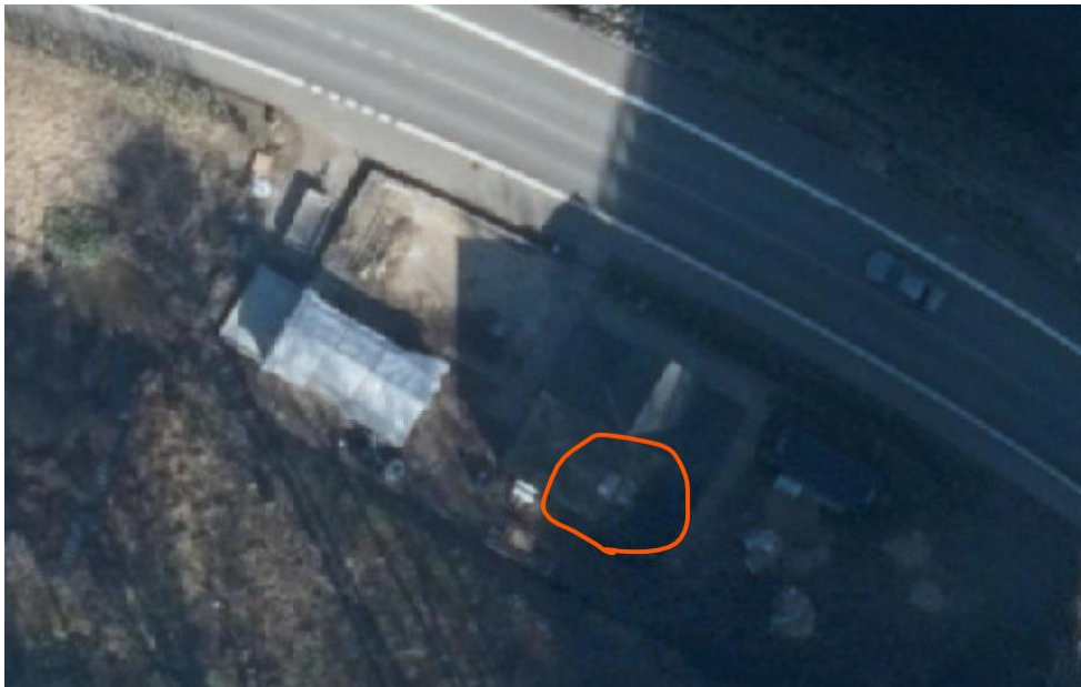
Seneste ortofoto viser de to tagvinduer.