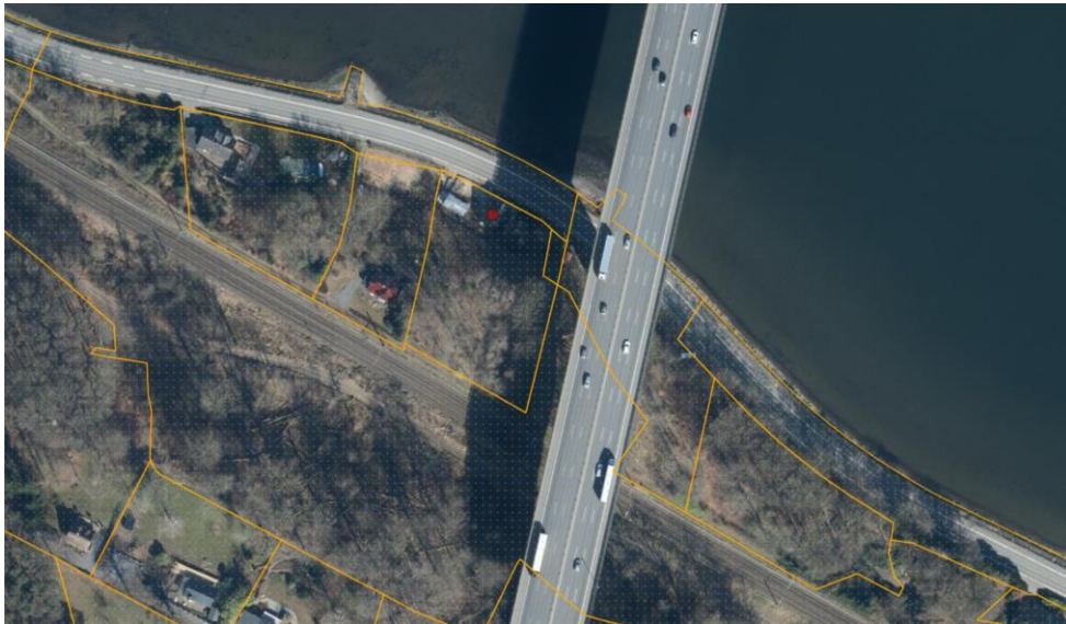
Luftfoto af området. Ejendommen er markeret med rød prik, og strandbeskyttelseslinjen er vist med orange signatur.