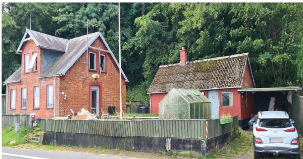
Foto af forholdene før.

Boligen har ifølge BBR et boligareal på 119 kvm, fordelt på 84 kvm i stueplan og 35 kvm udnyttet tagetage. Ejeren oplyser, at han har udnyttet førstesalen bedre og opnået lidt flere kvm, som han gerne vil have registreret i BBR. Den bedre udnyttelse indebærer, at det samlede boligareal øges fra 119 kvm til 140 kvm. Der er samtidig isat to tagvinduer i den tagflade, der vender væk fra kysten.