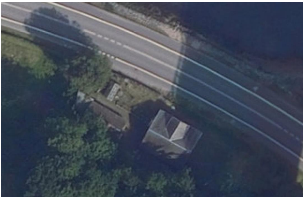
Ortofoto 2022 viser boligen uden tagvinduerne.