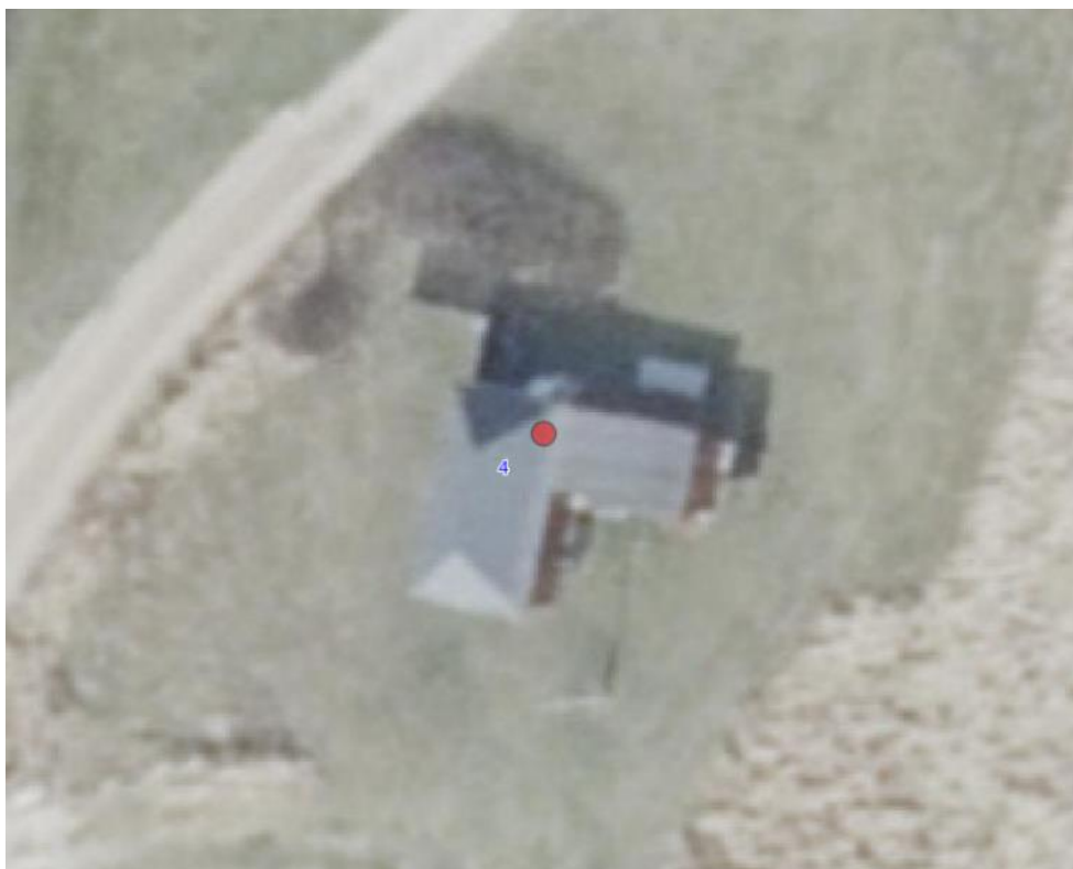
Luftfoto af sommerhuset og udenomsarealer.