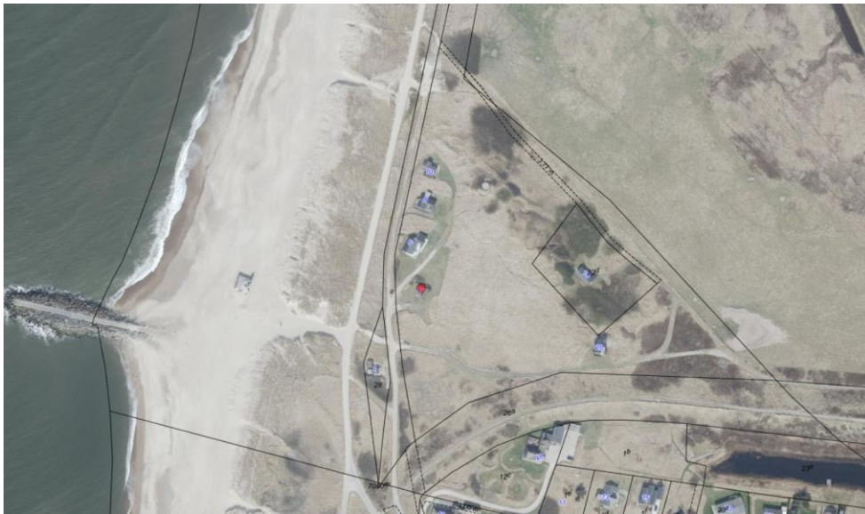
Luftfoto af området. Klitvej 4 er markeret med rød prik.

Dækslet etableres i niveau med terrænet.