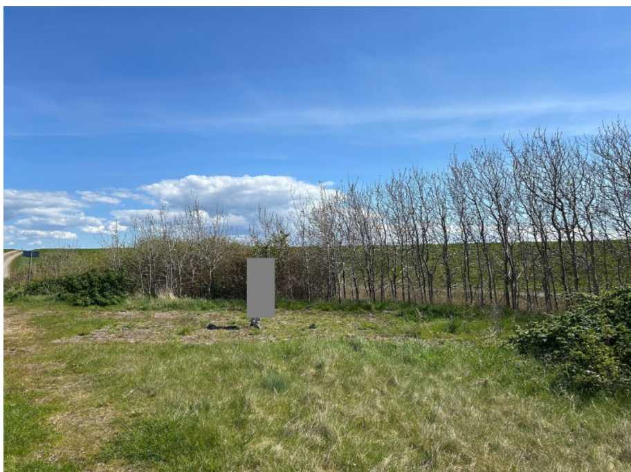
Fig. 3. Tilsendt fra ansøger. Billede af den ansøgte placering.