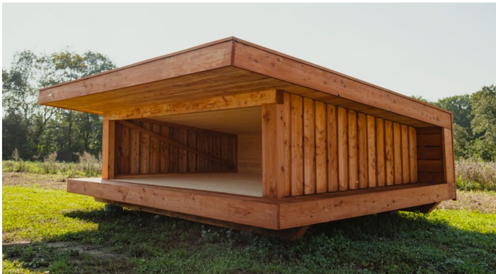
Fig. 5. Billede af den ansøgte model af shelters fra siden.