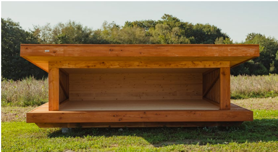
Fig. 4. Tilsendt fra ansøger. Billede af den ansøgte model af shelters forfra.