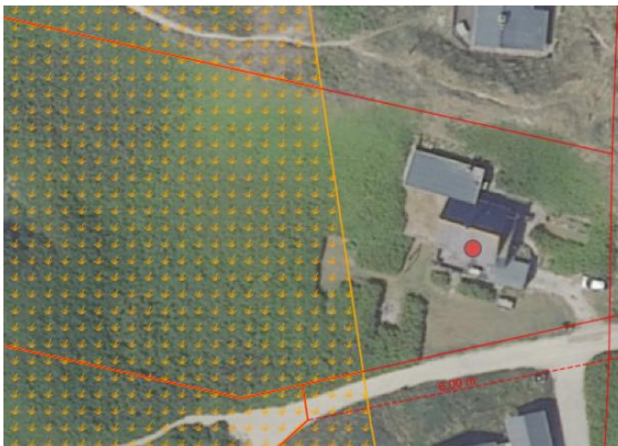
Ejendommen – klitfredet areal markeret gul