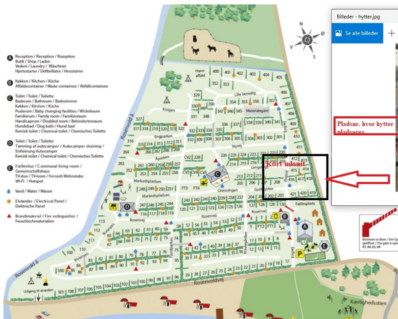
Fig. 3. Pladskort over campingpladsen fra Kystdirektoratets afgørelse fra 2021.