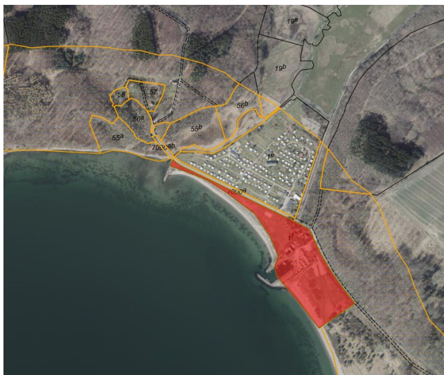
Fig. 1. Ortofoto af ejendommen fra foråret 2025. Den orange linje markerer strandbeskyttelseslinjen og det strandbeskyttede areal er markeret med orange prikker. De sorte streger markerer de vejledende matrikelskel. Den ansøgte matrikel er markeret med rød.

I en afgørelse fra 15. december 2021 (sag j.nr. 21/20535) gav Kystdirektoratet dispensation til, at der måtte opstilles tre campinghytter på pladsen. Af afgørelsen fremgår, at Rosenvold Strand Camping består af omtrent 350 campingenheder (se fig. 3).