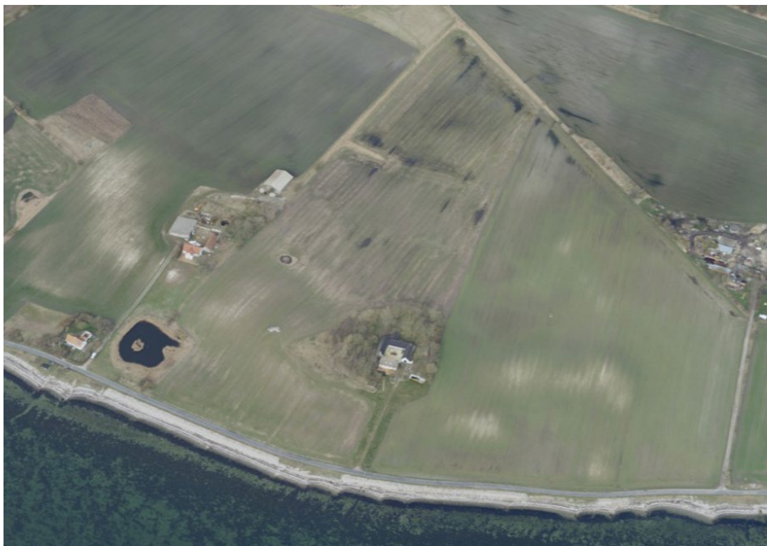
Fig. 3. Skråfoto af den ansøgte matrikel fra 2023.