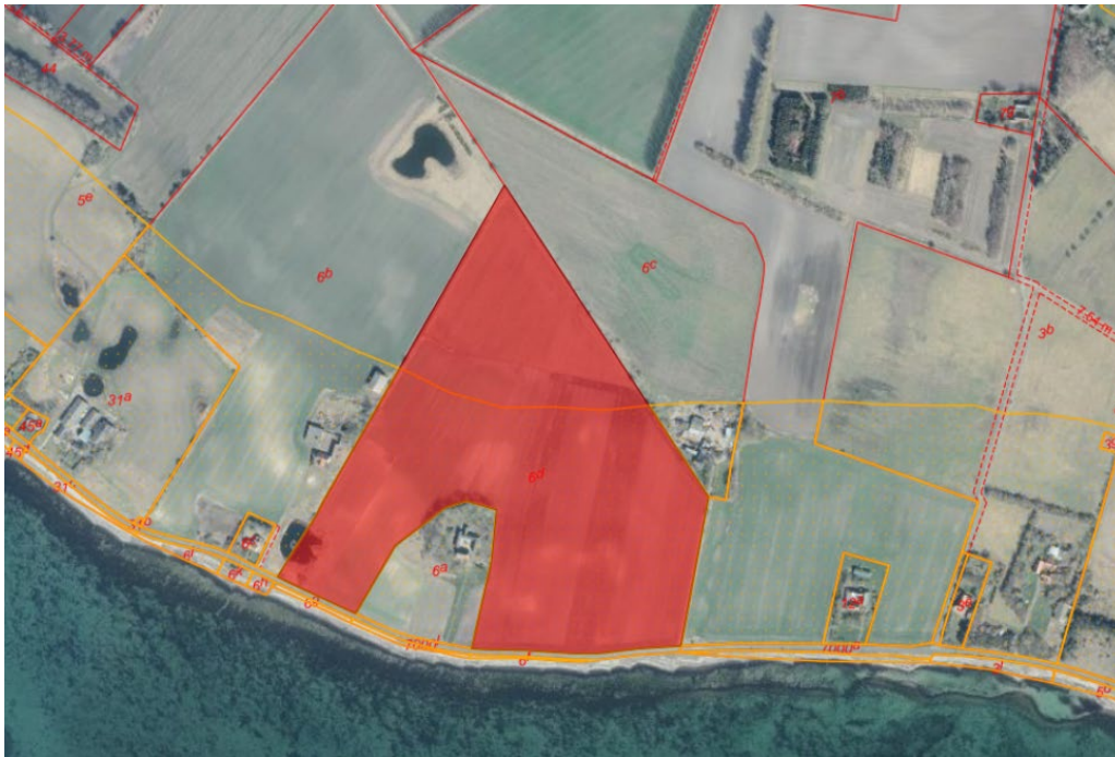
Fig. 1. Ortofoto 2025. Det strandbeskyttede areal er markeret med orange signatur. De røde streger markerer de vejledende matrikelskel. Den røde matrikel markerer den ansøgte matrikel.

Af ansøgningen fremgår det, at der ansøges om ca. 3,3 ha skovrejsningen inden for strandbeskyttelseslinjen, hvor den samlede skovrejsning projekteres til ca. 4,4 ha. Der ansøges om beplantning bestående af bøg, douglasgran, eg, fuglekirsebær, rødell og generelt skovbryn. Ansøgningen begrundes med et ønske om at omlægge landbrugsjord til skov.