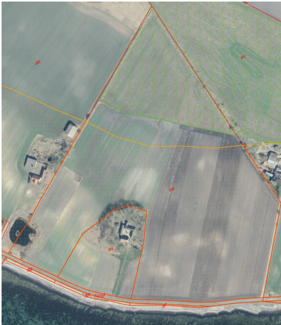
Fig. 4. Ortofoto 2025. Det strandbeskyttede areal er markeret med orange signatur. Arealet med fredskov er markeret med grøn signatur. De røde streger markerer de vejledende matrikelskel.

Ved gennemgang af de oplysninger Kystdirektoratet har adgang til, kan direktoratet konstatere at der er etableret skov på den nordligste del af matriklen i perioden mellem 2023 og 2025, dette areal er blevet registeret som fredskov i 2025. I forbindelse med etableringen af fredskoven er der etableret en kile mellem arealet med fredskov og det strandbeskyttede areal. Se figur 4.