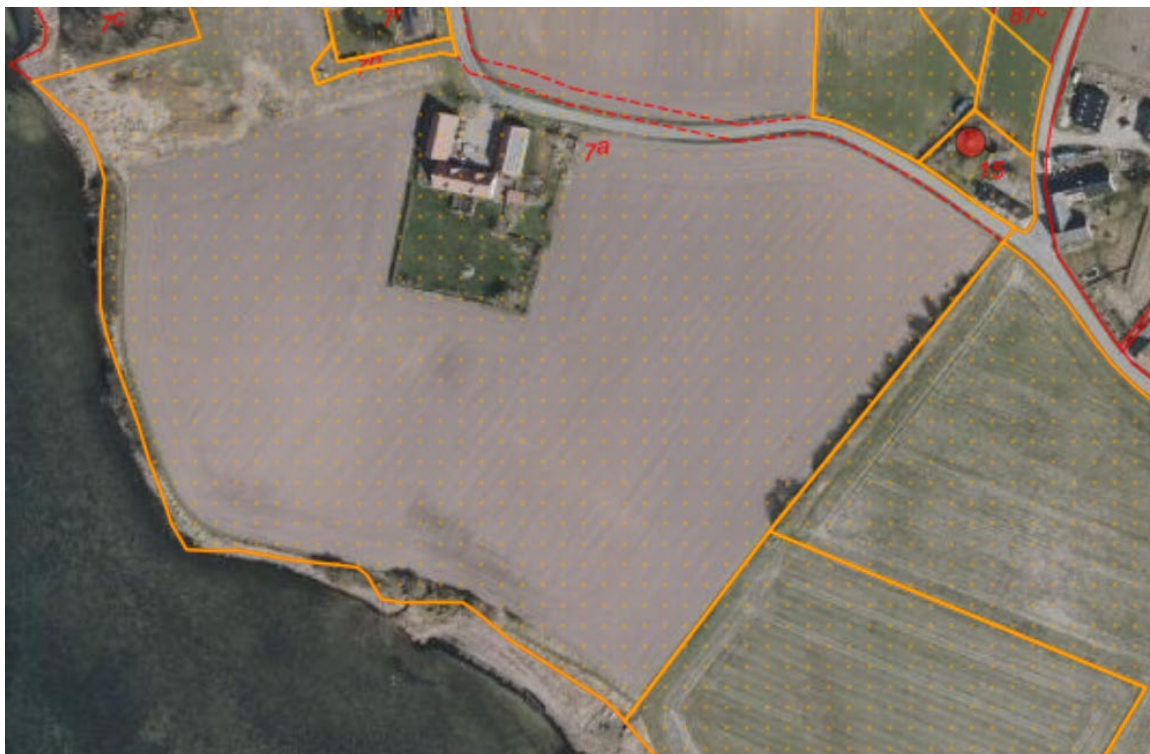
Fig. 1. Ortofoto 2025. Det strandbeskyttede areal er markeret med orange signatur. De røde streger markerer de vejledende matrikelskel. Den røde prik markerer det tidligere samt ønskede placering af annekset.

Jordstykket matr.nr. 15, Strandhuse, Ulbølle, ligger i landzonen i Strandhuse, mellem Faaborg og Svendborg. Matriklen er i sin helhed omfattet af strandbeskyttelseslinjen, se fig. 1.