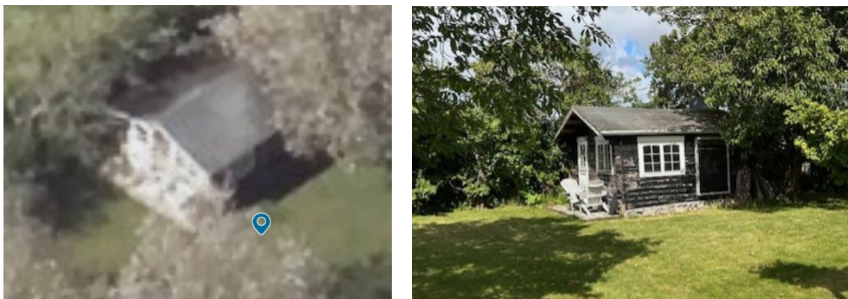
Fig. 2. Venstre; Skråfoto 2023 af det eksisterende annekset. Højre; Foto af det tidligere annekset, indsendt af ansøger.

I ejendommens BBR-oplysninger fremgår det at der er et eksisterende annekset med et samlet bygningsareal på 16 m 2 , se fig. 2.