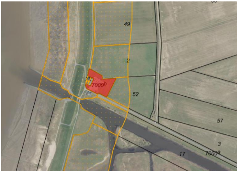
Fig. 1. Ortofoto 2025. Det strandbeskyttede areal er markeret med orange signatur. De sorte streger markerer de vejledende matrikelskel. Det røde område markerer den ansøgte matrikel.

Visualisering af skiltet på den ansøgte placering ses på figur 5.