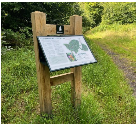
Fig. 3. Tilsendt af ansøger. Eksempel på udformningen af skiltet.