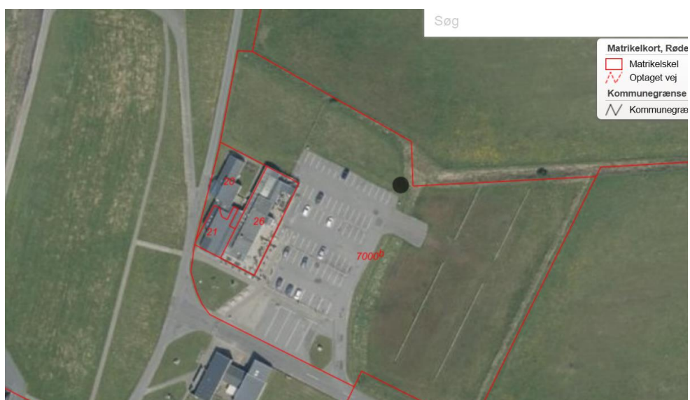
Fig. 2. Tilsendt af ansøger. På figuren er skiltets placering markeret med en sort prik.