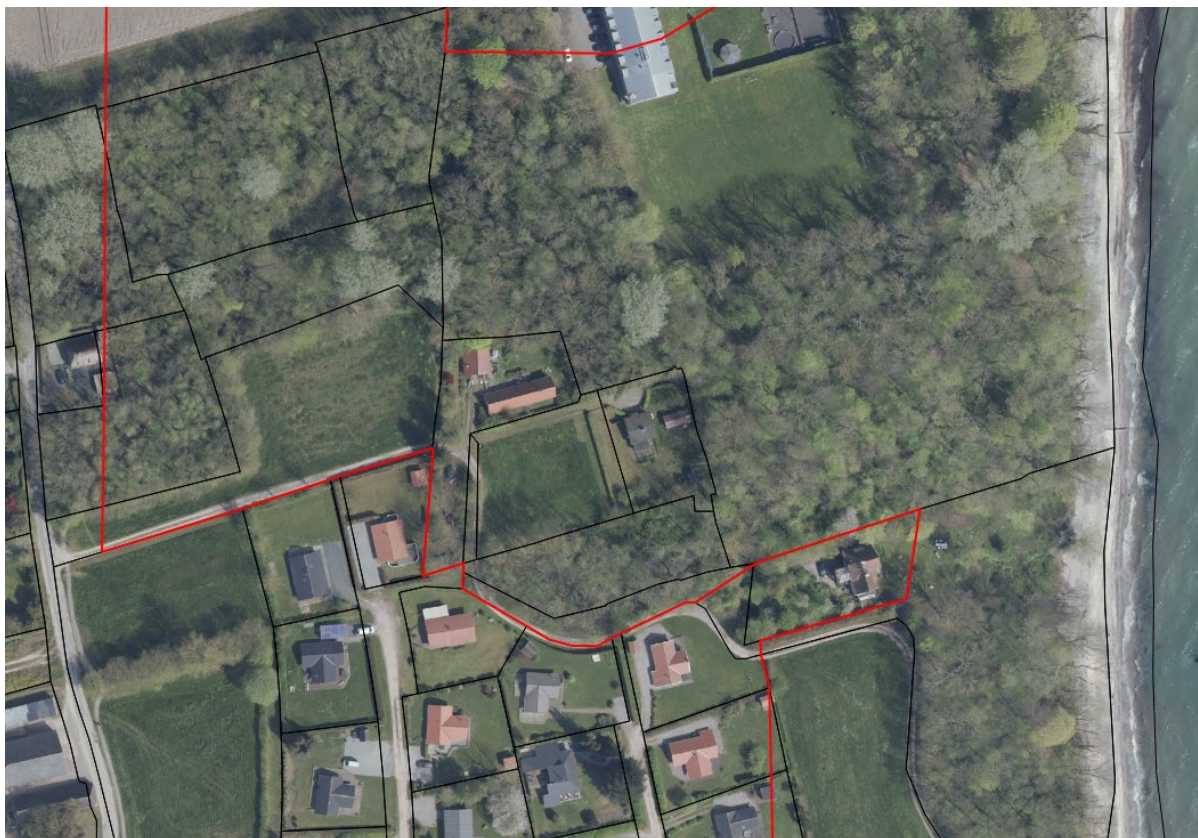
Fig. 3. Ortofoto 2024. Den røde linje markerer strandbeskyttelseskommisionens forslag til linjeføringen på nærværende strækning. Matr. 113 og 130, Mommark, Lysabild var begge omfattet af strandbeskyttelseslinjen i strandbeskyttelseskommisionens forslag.

Strandbeskyttelseskommisionens forslag til linjeføringen på nærværende strækning kan ses på figur 3. Det fremgår, at matr. 113 og 130, Mommark, Lysabild begge var omfattet af strandbeskyttelseskommisionens foreslåede linjeføring, som blev sendt i høring hos de berørte lodsejere.