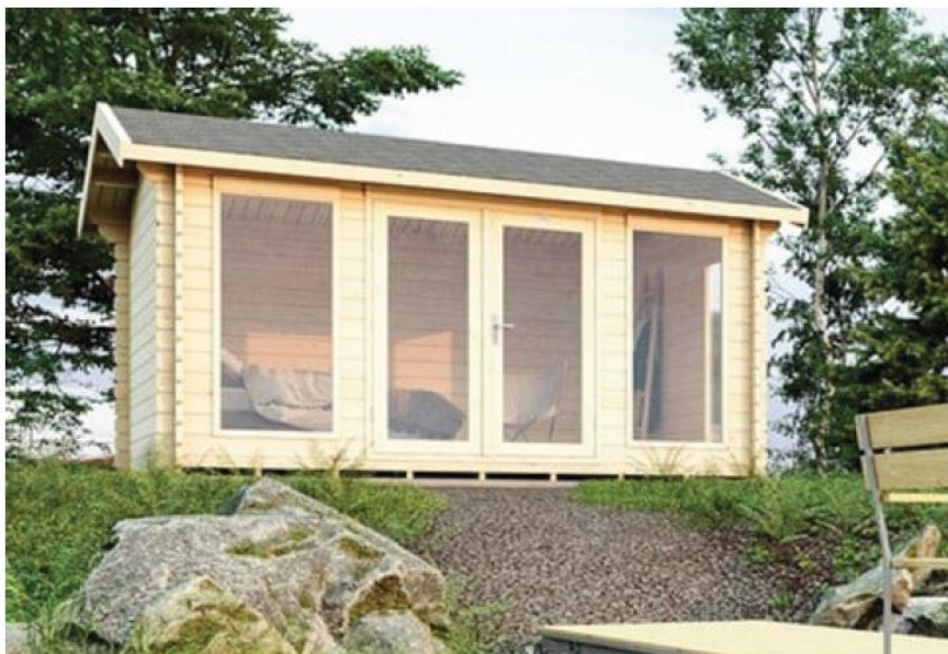
Producentens visualisering af badehuset