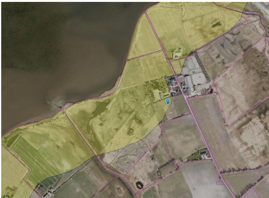
Luftfoto viser området. Gul flade viser strandbeskyttet areal. Lilla streger er matrikelskel. Blå nål markerer omtrentlig placering for den ønskede ridehal.

Det fremgår af den nye ansøgning, at der i forbindelse med en drøftelse med Odense Kommune om landzonetilladelse er blevet klarhed over, at ejendommen gennemskæres af to sæt 60KV højspændingsledninger, hvortil der skal holdes en respektafstand på 15 meter fra bebyggelse. Dette har medført, at det ikke længere er muligt at placere bygningen uden for strandbeskyttelseslinjen, hvorfor der igen søges om at opføre en ridehal inden for strandbeskyttelseslinjen.