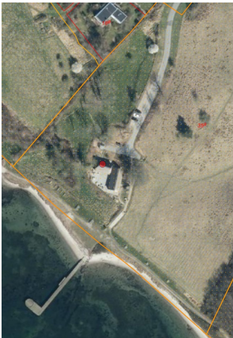
Fig. 1. Ortofoto 2025. Det strandbeskyttede areal er markeret med orange signatur. De umatrikulerede arealer ud til kysten samt stranden er dog også omfattet af bestemmelserne om strandbeskyttelse. De røde streger markerer de vejledende matrikelskel.

Begge bygninger placeres således at de ikke kan ses fra kysten og vandet fordi de er skjult bag eksisterende bygninger og beplantning. Der er tale om træbygninger med fladt tag, så de fylder så lidt som muligt. Bygningerne vil kun kunne ses fra den bagvedliggende parkeringsplads for området gæster. Strandparken er i forvejen et populært område med et stort besøgstal og det vurderes at cafeen i sig selv ikke skaber øget tryk på kystområdet og stranden, men løfter naturformidling og serviceniveau og skaber et samlingspunkt for de besøgende som kom i området i forvejen.