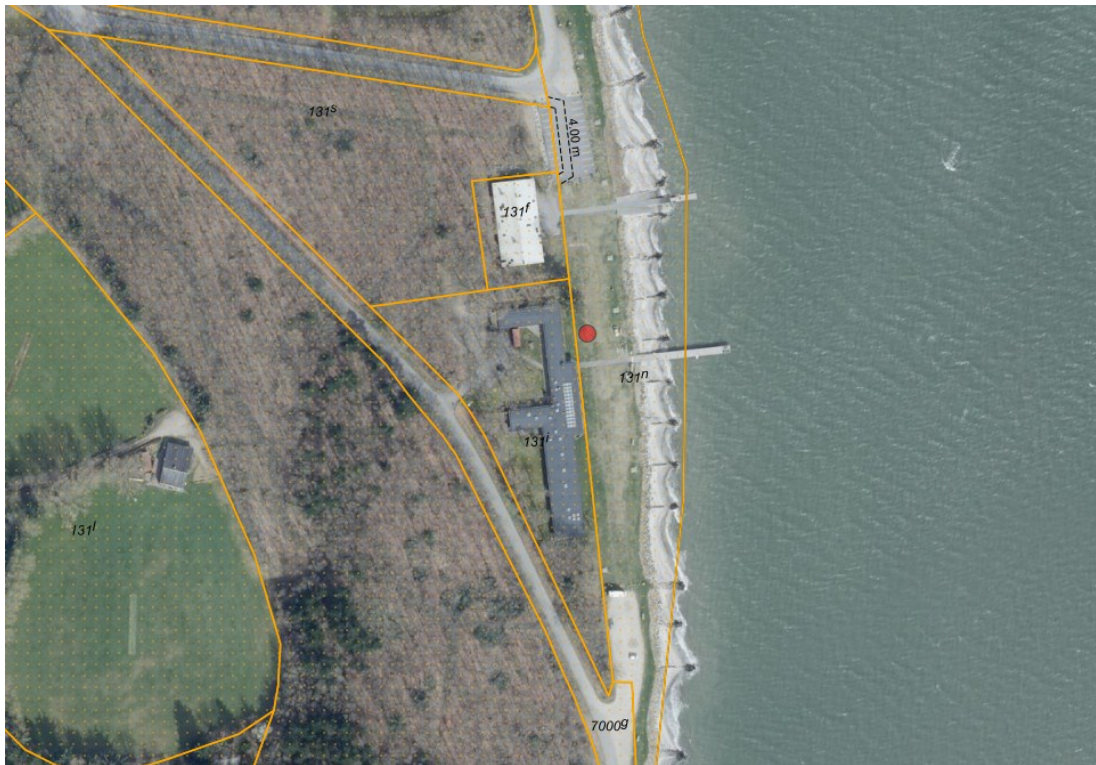
Fig. 1. Ortofoto 2025. Det strandbeskyttede areal er markeret med orange signatur. De sorte streger markerer de vejledende matrikelskel. Den røde prik markerer den ønskede placering af teltet.

Jordstykket, 131n, Nykøbing M. Markjorder, ligger i landzonen på østsiden af Nykøbing Mors. Størstedelen af Matriklen er omfattet af strandbeskyttelseslinjen, hvoraf det ansøgte i sin helhed ønskes placeret inden for strandbeskyttelseslinjen, se fig. 1.