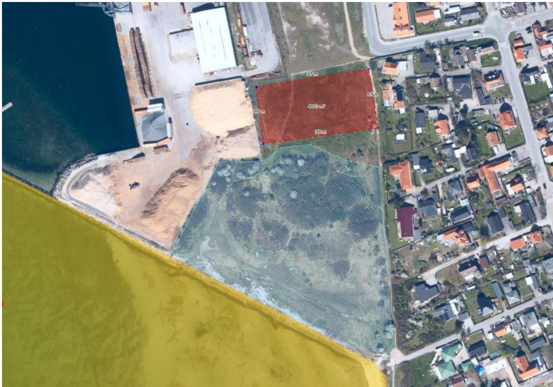
Udsnit af luftfotoet oven for.

Den røde flade på figuren oven for viser et område, inden for hvilket materiel opstilles. Området fremstår med græs. Den blå flade markerer strandeng, som er beskyttet efter naturbeskyttelseslovens §3. Der opstilles ikke materiel på strandengen. Gul flade på figuren markerer Natura 2000-område. Se mere herom neden for under afsnittet ”Vurdering efter lovgivning om international naturbeskyttelse”.