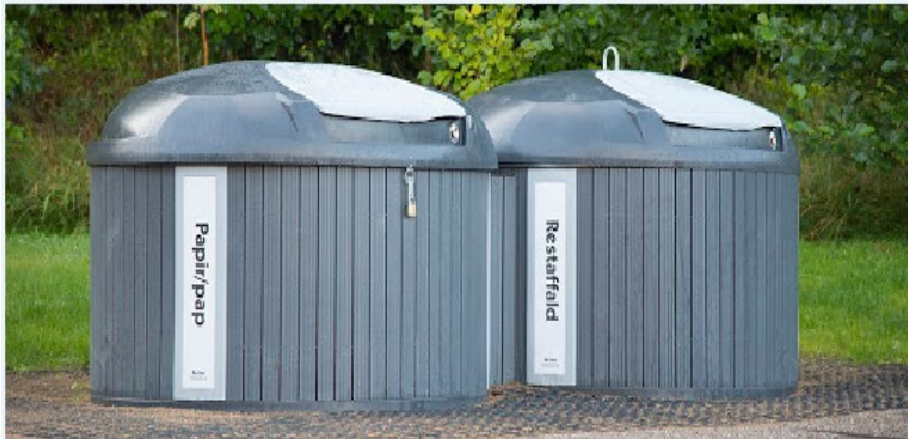
Figur 3. Visualisering jf. ansøgning af affaldscontainerne der opstilles 2 steder.