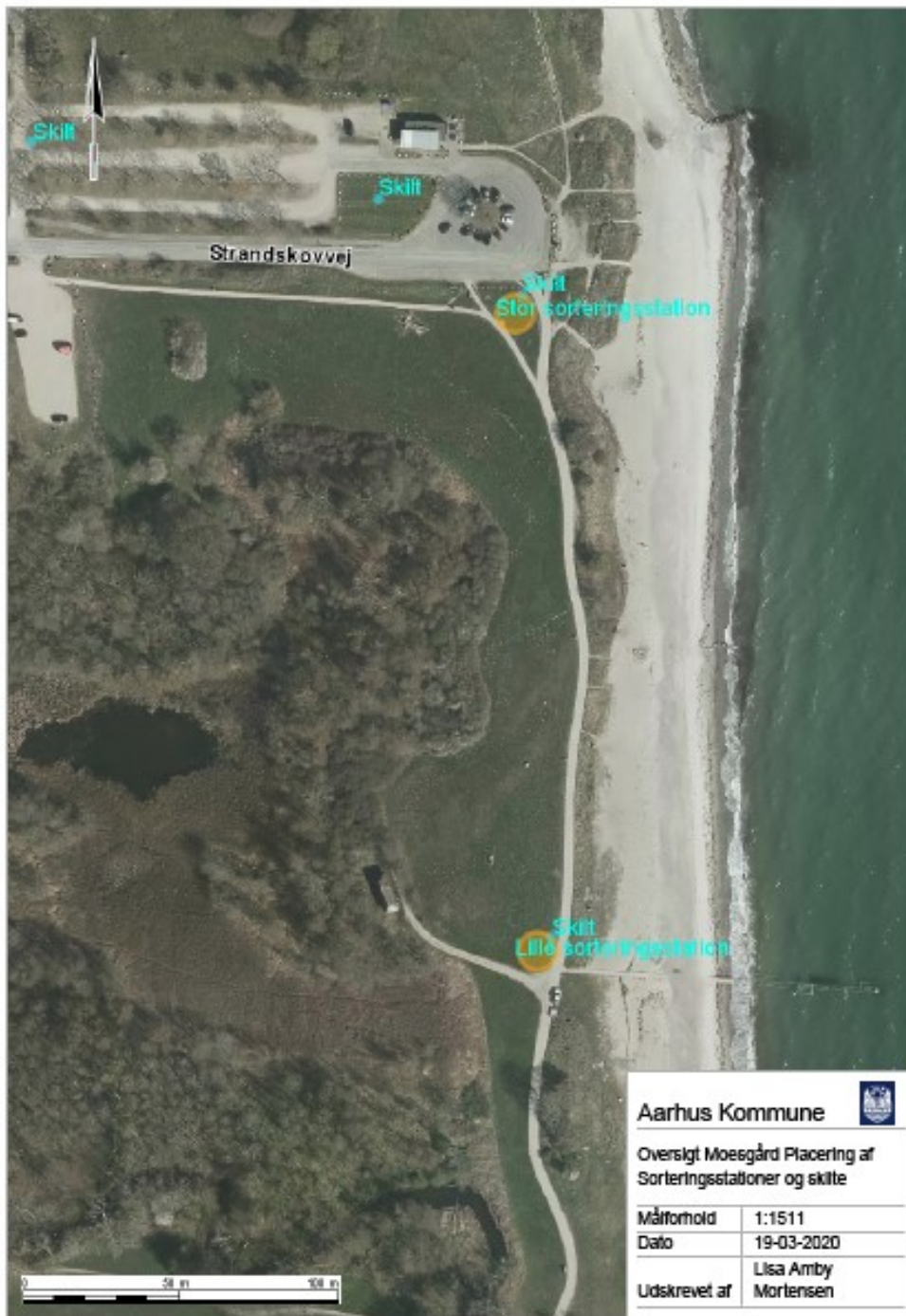
Figur 2. Opstilling af skiltning i testperioden er markeret med turkis skrift og de orange prikker angiver affaldsstationerne.