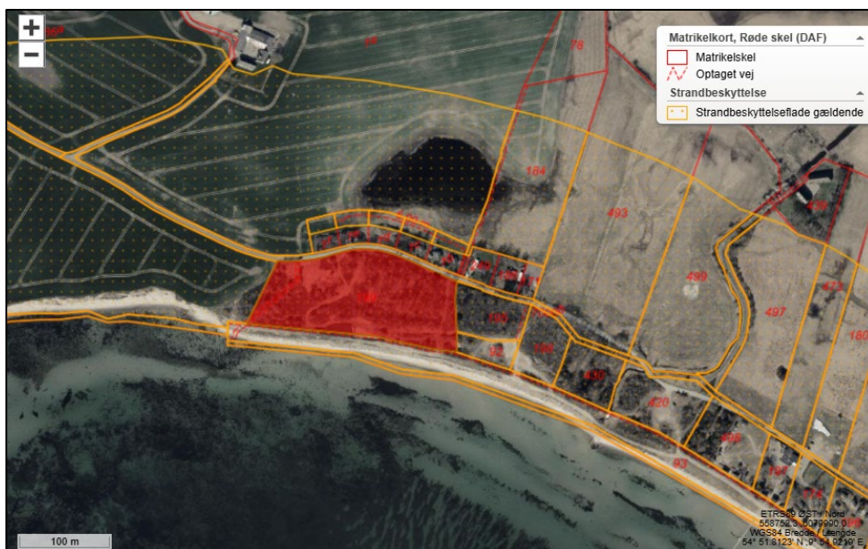
Fig. 1. Ortofoto 2025. Det strandbeskyttede areal er markeret med orange signatur. De røde streger markerer de vejledende matrikelskel. Den ansøgte matrikel (matr.nr. 199) er markeret med rød farve.

Foto af den ansøgte placering ses i figur 5.