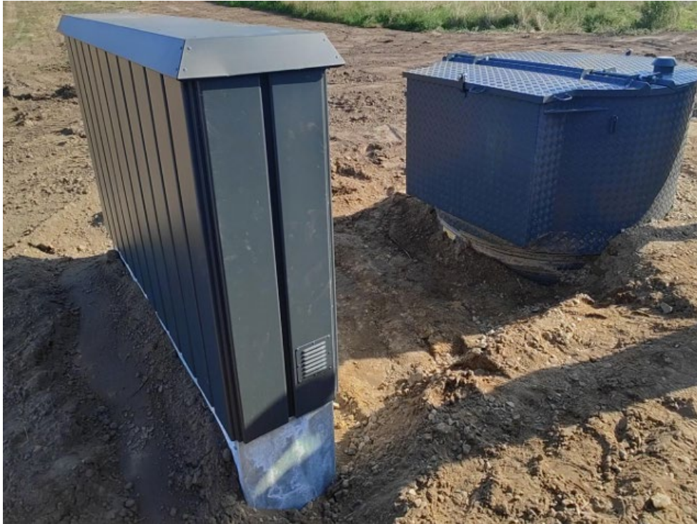
Fig.4. Tilsendt af ansøger. Et eksempel af tilsvarende pumpestation og styreskab.