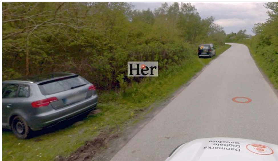
Fig. 5. Billede af den ansøgte placering.