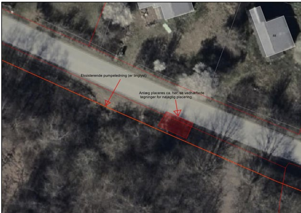
Fig. 2. Tilsendt af ansøger. Oversigtskort med den ansøgte placering. Placering er markeret med en rød polygon.