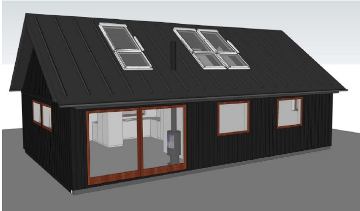
Eksisterende forhold (over) og ansøgte under

Der ansøges om at opsætte en kvist midt på taget til erstatning for 4 tagvinduer anbragt i "Dannebrosform".