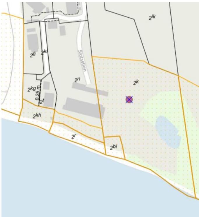
Fig. 1. Kortudsnit af matr.nr. 2k, Erritsø By, Erritsø, som er markeret med rød prik. Det strandbeskyttede areal er markeret med orange signatur. De sorte streger markerer de vejledende matrikelskel.