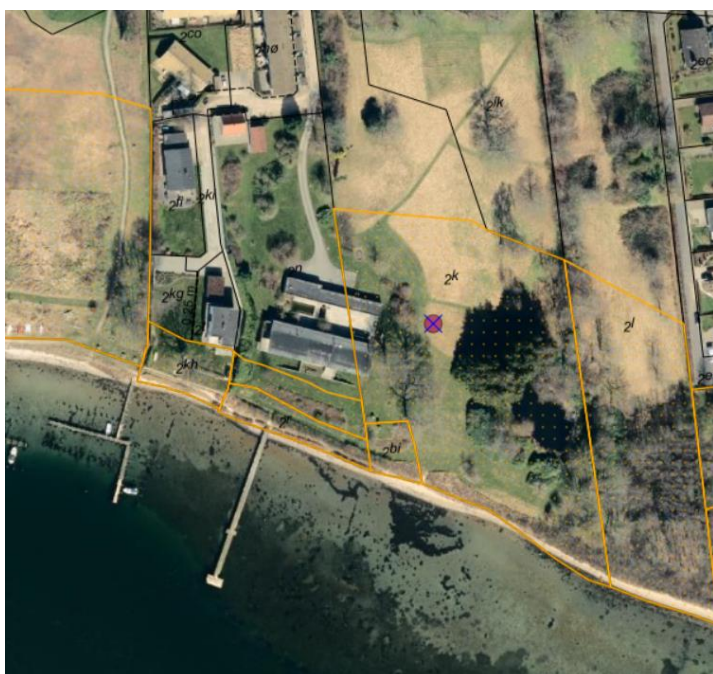
Fig. 2. Ortofoto 2025. Det strandbeskyttede areal er markeret med orange signatur. De sorte streger markerer de vejledende matrikelskel. Den røde prik markerer matr.nr. 2k, Erritsø By, Erritsø.