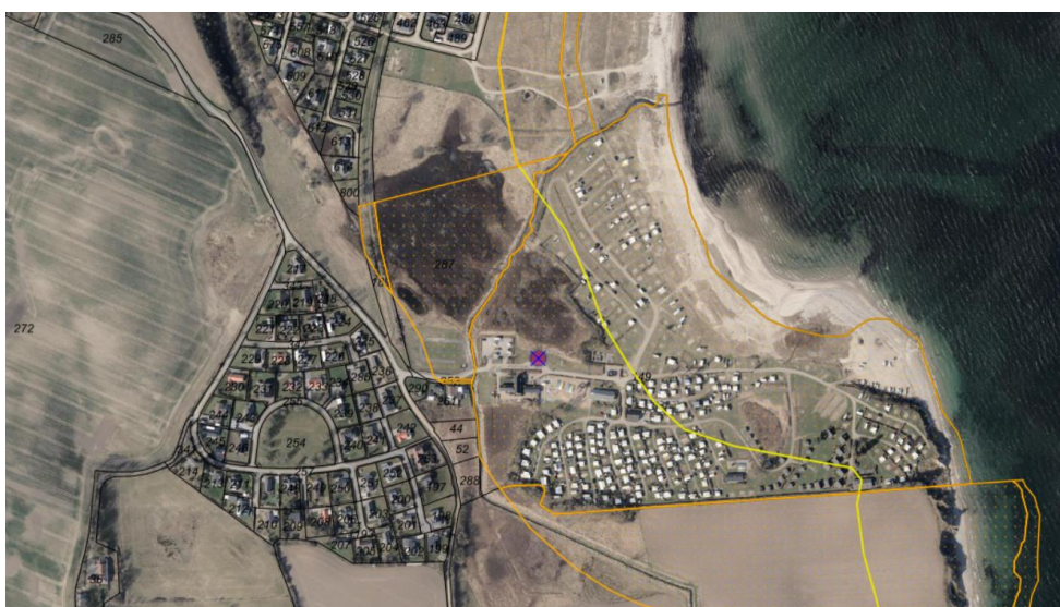
Fig. 1 Ortofoto 2025. Det strandbeskyttede areal er markeret med orange signatur. De sorte streger markerer de vejledende matrikel. Den gule linje markerer den oprindelige strandbeskyttelseslinje.

En skitsetegning af den ansøgte bygning ses på figur 4.