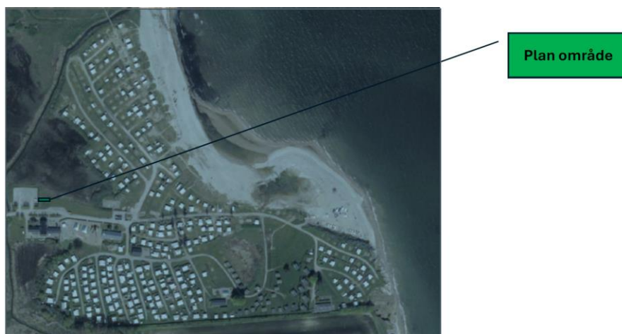
Fig. 2. Kort over den ansøgte placering vedlagt ansøgningen.