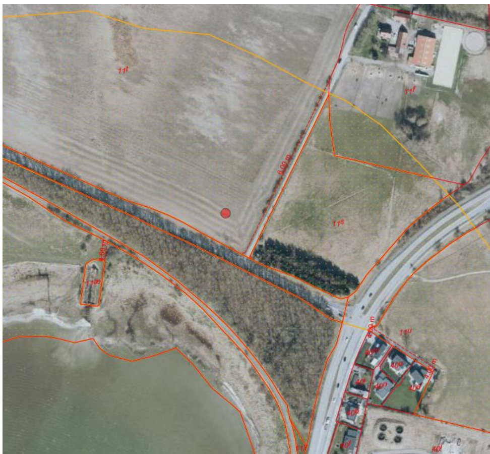
Fig. 2. Ortofoto 2025. Det strandbeskyttede areal er markeret med orange signatur. De røde streger markerer de vejledende matrikelskel. Den røde prik angiver det ansøgte placering.

Den 16. marts 2026 blev der meddelt en ændring til den gældende dispensation af 30. juni 2025, idet der i stedet for et telt var behov for to telte, ligesom de i højden blev justeret fra 5 til 4 meter.