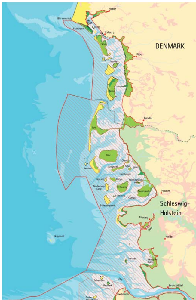
Figur 3.1 Oversigtskort af den dansk-tyske del af Vadehavet 1

Som anført i kapitel 2.3, omhandlede øvelsen en meget alvorlig stormflod som rammer Nordsøekysten i den nordlige del af Schleswig-Holstein og i Syd- og Sønderjylland Politis geografiske ansvarsområde, jf. figur 3.1. Inden for dette område har menneskelig aktivitet og naturlige processer flettet sig sammen på uforlignelig vis gennem flere årtusinder.