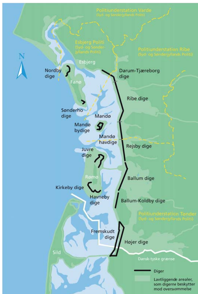
Figur 3.2 Oversigt over diger i den danske del af Vadehavet (Kystdirektoratet)

Stormfloderne følger derimod ikke en regelmæssig rytme og kan kun varsles nogle få dage før de indtræffer. Der findes ingen præcis tal på de menneskeliv og dyreliv, stormfloderne har taget over flere århundreder. Alene under stormfloden i oktober 1634 skal over 500 menneskeliv være omkommet mellem Tønder og Ribe. Flere landsbyer blev udslettet på en nat.