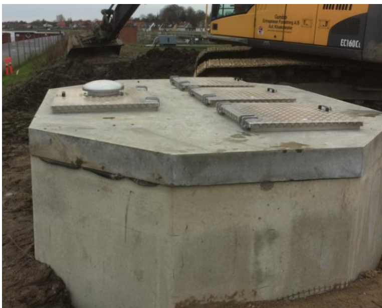
Fig. 4. Tilsendt fra ansøger. Billede af lignende pumpestation.