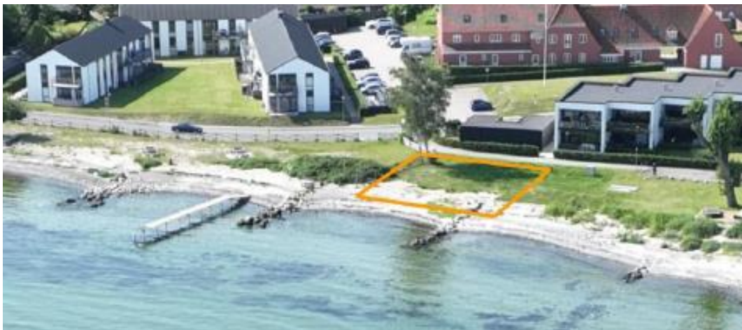
Fig. 2. Tilsendt fra ansøger. Billede af den ansøgte matrikel set fra kysten.