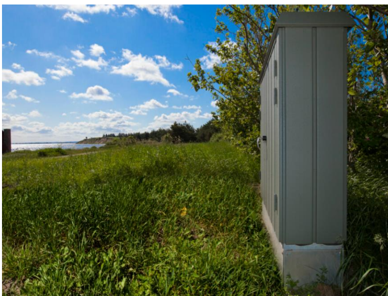
Fig. 5. Billede af lignende teknikskab.

Ansøger oplyser følgende i ansøgningsmaterialet: