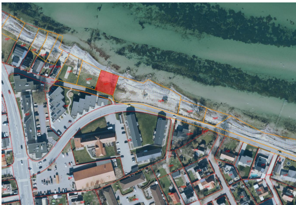
Fig. 1. Ortofoto 2025. Det strandbeskyttede areal er markeret med orange signatur. De røde streger markerer de vejledende matrikelskel. Den røde markerede matrikel er den ansøgte matrikel.

Efter etablering af pumpestationen vil den måle ca. 1 x 4 x 3 m (højde x længde x bredde). I forbindelse med etableringen af pumpestationen skal der også etableres et teknikskab, som måler ca. 1,2-1,4 meter i højden og 1,5 meter i bredden.