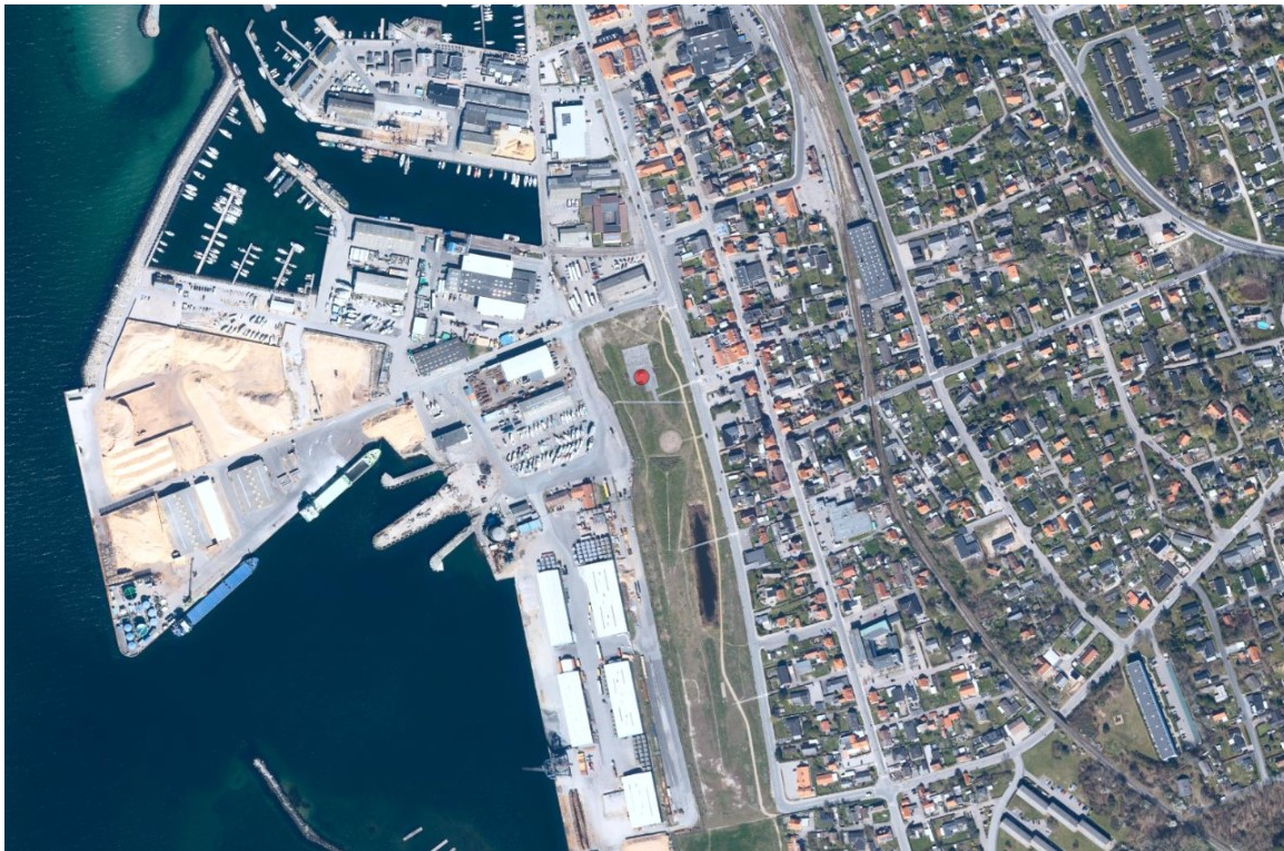
Luftfoto af området. Festivalpladsen ligger ved den røde prik. På fotoet ses også Hundested by og havn.