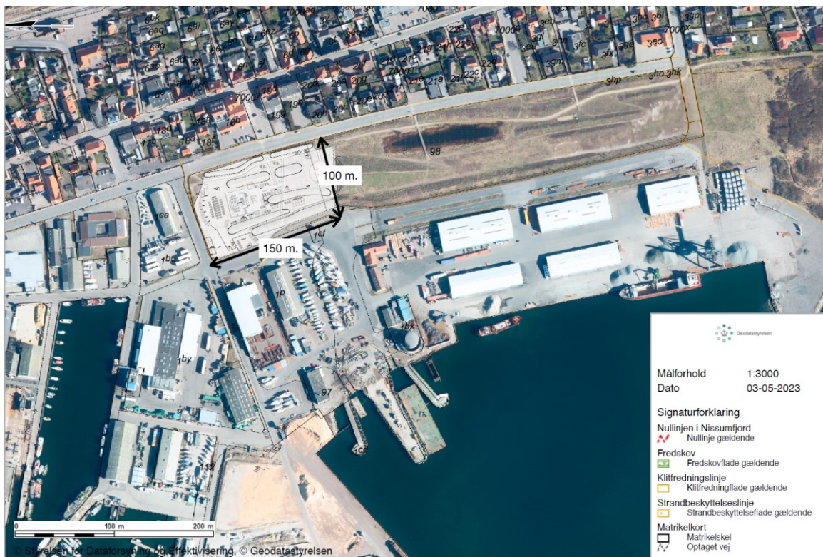
Plan indsat fra ansøgningen viser festivalens placering i "Mellemrummet". Nord er til venstre på tegningen.