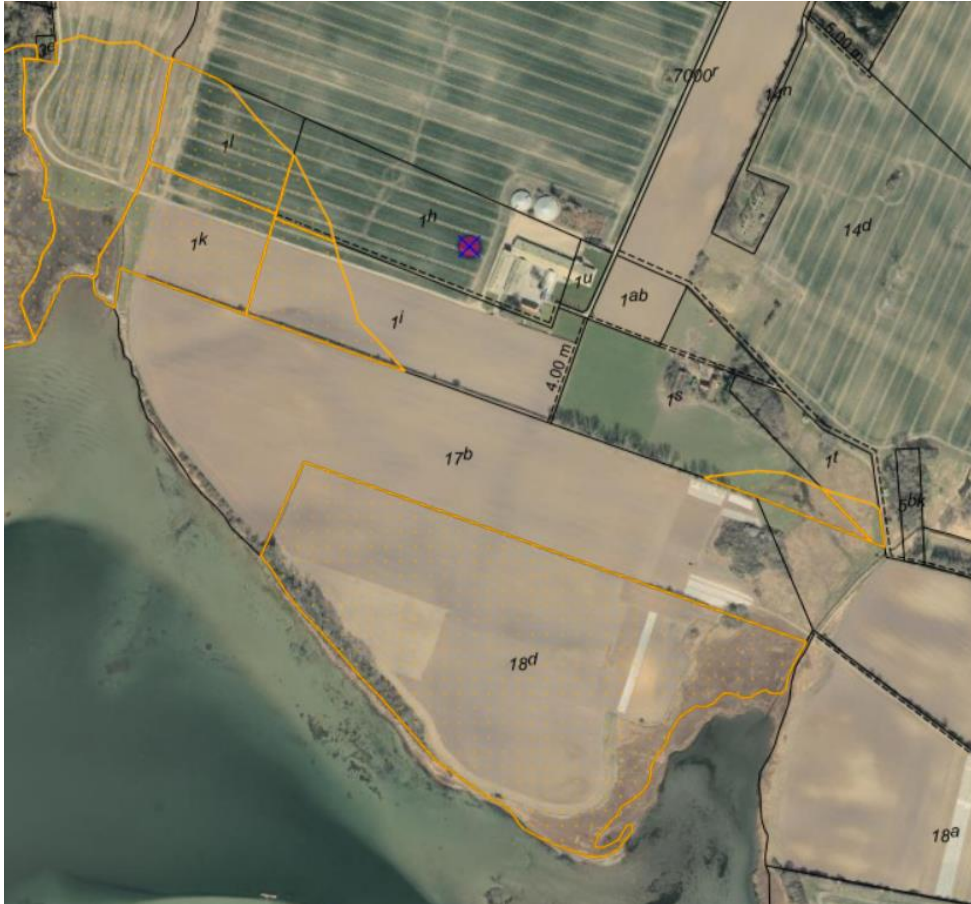
Fig. 1. Ortofoto 2025. Det strandbeskyttede areal er markeret med orange signatur. De sorte streger markerer de vejledende matrikelskel. Den røde prik markerer matr.nr. 1h Gamborg By, Gamborg, Nymarkvej 8, 5500 Middelfart i Middelfart Kommune.

Arealet, der søges udstykket, er delvist beliggende inden for strandbeskyttelseslinjen, og derved søges der om fastlæggelse af skel inden for det strandbeskyttede areal, se figur 2.