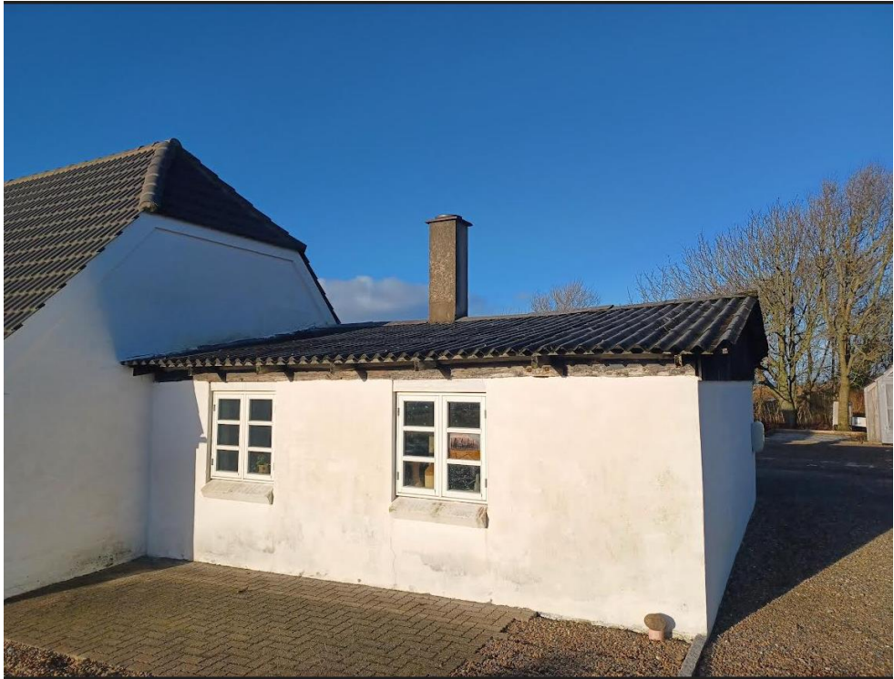
Fig. 2. Billede vedlagt ansøgningen.