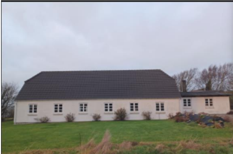
Fig 3: Billede vedlagt ansøgningen.

Ansøger har telefonisk oplyst til Kystdirektoratet, at hovedbygningen måler omtrent 7 meter til kip. Bygningen, hvor der ansøges om udskiftning af tag, måler omtrent 3,5 meter til kip. Derved bliver det ansøgte omtrent 1,5 meter under den nuværende valm på hovedbygningen.