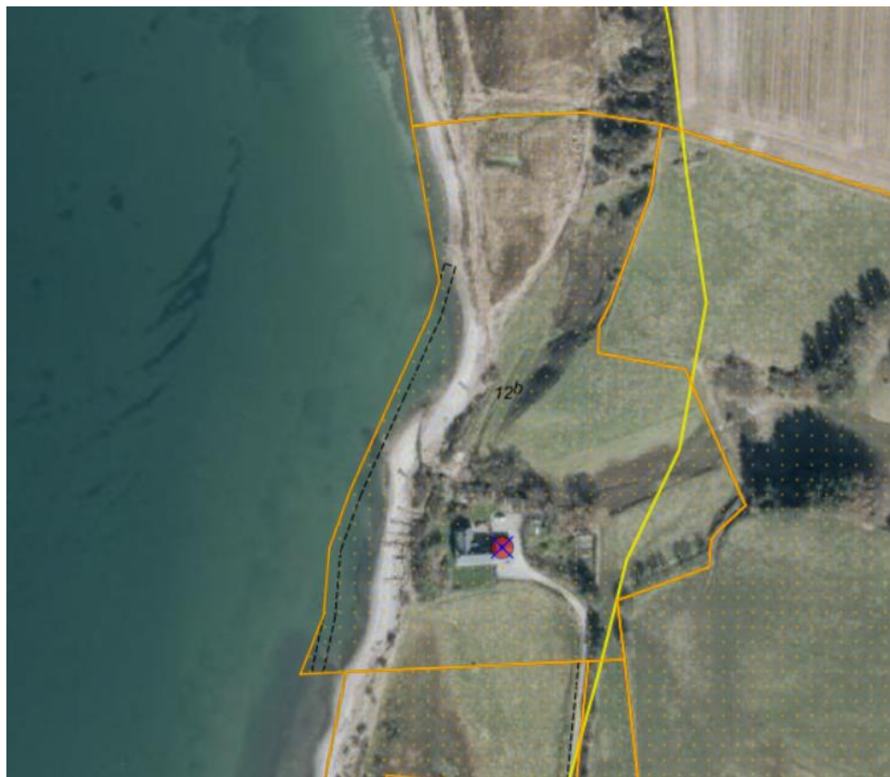
Fig. 1. Ortofoto 2025. Det strandbeskyttede areal er markeret med orange signatur. Den gule streg markerer den oprindelige 100-meter linje. De sorte streger markerer de vejledende matrikelskel. Den røde prik markerer den ansøgte placering.

Matriklen er i sin helhed beliggende inden for strandbeskyttelseslinjen og det ansøgte ligger inden for den oprindelige strandbeskyttelseslinje, se figur 1.