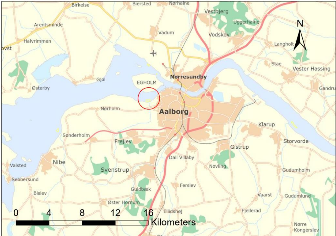
Figur 1: Oversigtskort, der viser placeringen af projektområdet (rød markering) ved udløbet fra Hasseris Å i Limfjorden.

Der planlægges udlægning af spredte sten i Limfjorden ved udløbet af Hasseris Å i Hasseris Bugt.