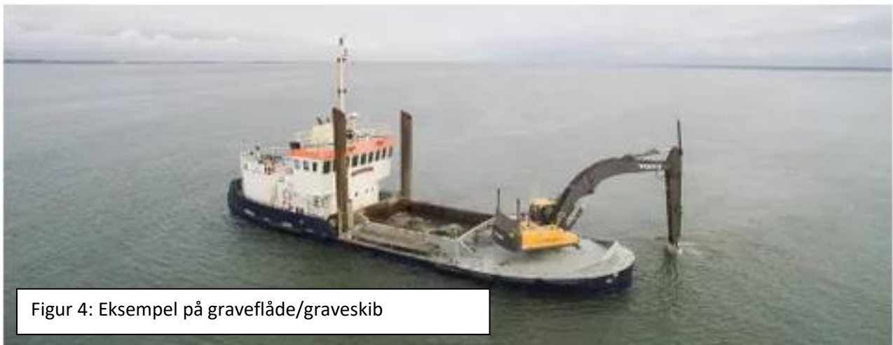
Figur 4: Eksempel på graveflåde/graveskib

Stenene udlægges med graveflåde/graveskib som eksempel på figur 4. På lavere vanddybder hvor en større graveflåde/graveskib ikke kan nå ind, kan stenene udlægges med slæbebåde eller med mindre pramme.