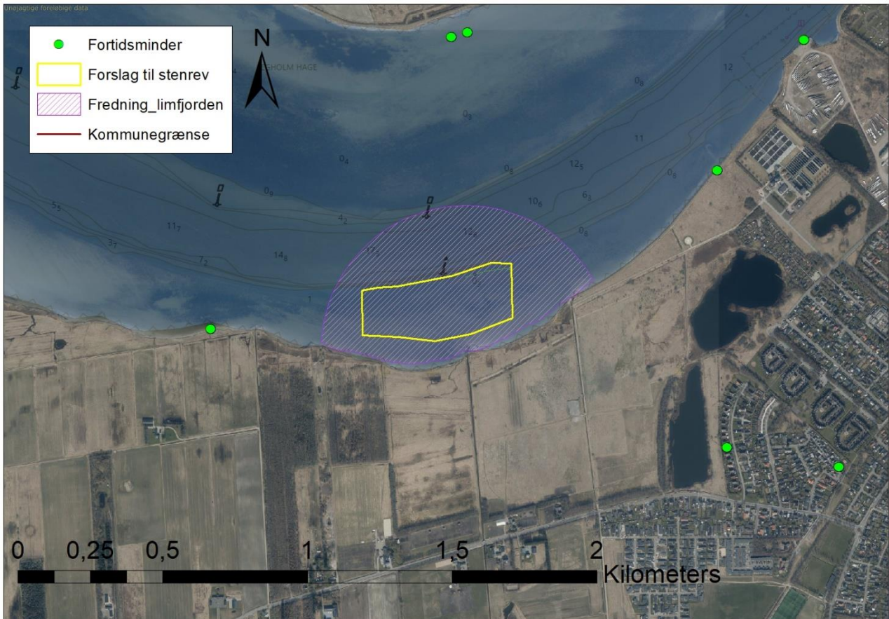
Figur 2: De gule markeringer skitserer, hvor der projekteres udlægning af spredte sten i området omkring Hasseris Å's udløb i Limfjorden. Området strækker sig fra ca. 1 til 3 m dybde.

Den 3. Limfjordsforbindelse er projekteret som en tunnel under fjorden netop, i den østlige ende af projektområdet. Så vidt vides, er der ikke planer om at fremrykke kystlinjen, hvor tunnelen går i jorden, og uanset går nærværende projektområde ikke helt ind til kysten. Vejføringens vurderes derfor ikke at påvirke nærværende projekt eller vise versa.