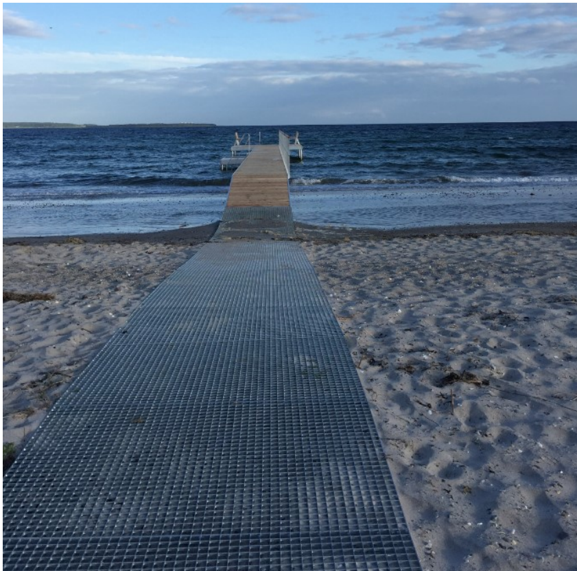
Billede af handicaprampen. Indsat fra ansøgningen

Ejendommen ligger i et fredet område (Ebeltoft Vig). Kystdirektoratet overlader til fredningsnævnet at afgøre, om det søgte strider imod fredningsbestemmelserne for området.