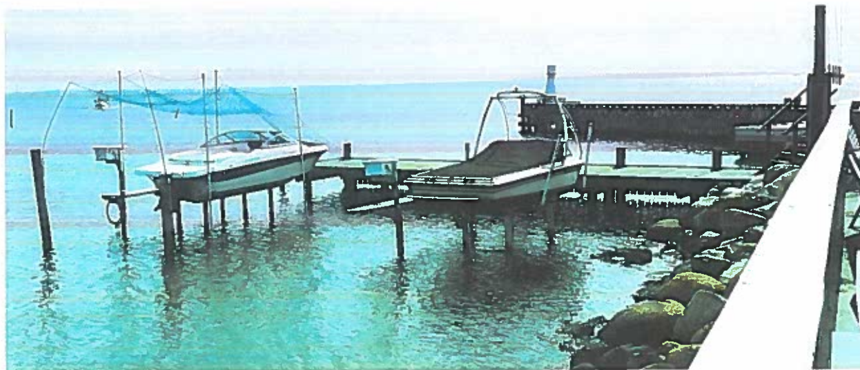
Figur 1 – Bådlift

Ved broanlæg på nordsiden af nordmolen var der opsat to bådlifte som begge var i anvendelse.