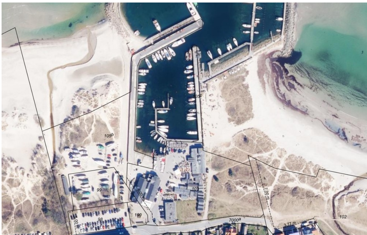
Luftfoto af området.