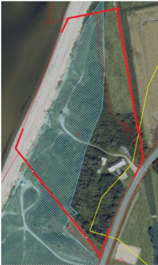
Rød er ejendommens udstrækning, gul 100 m af oprindelig strandbeskyttelseslinje – §3 areal blå