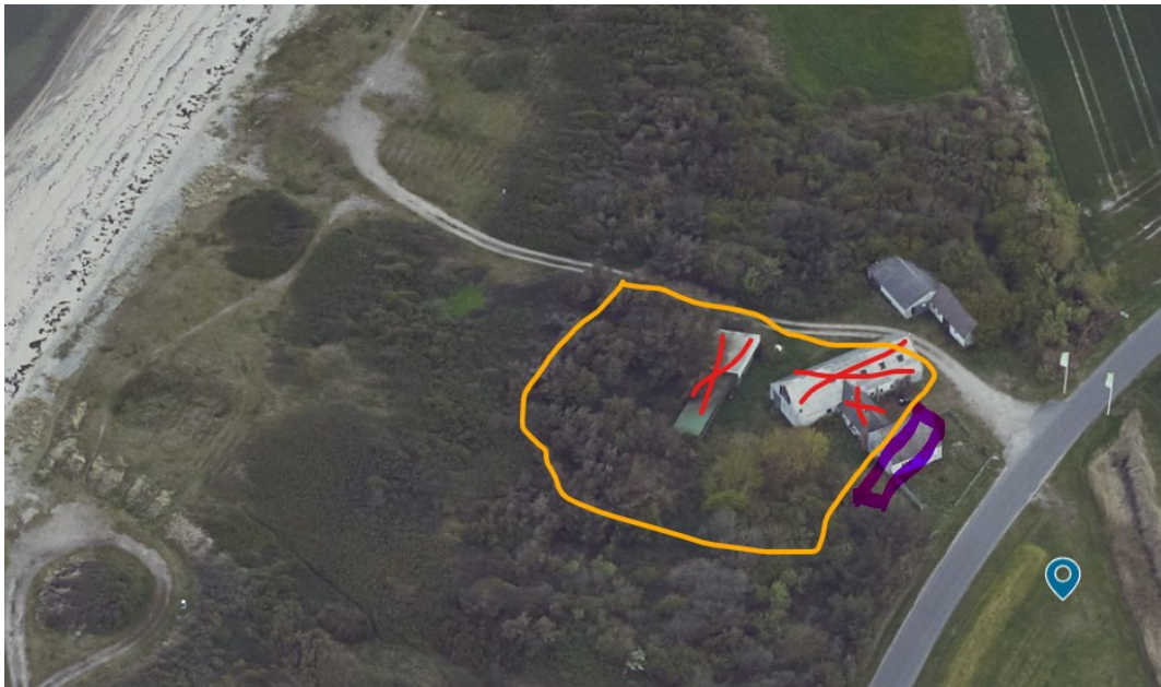
Oversigt over ejendommen – rød markerer bygninger der fjernes, lilla "omtrentlig" placering af ny boiøg – gul udlæg af areal til have

Der ansøges endvidere om at udlægge 2.500 m 2 mellem strandengen og det nye stuehus til haveareal. Dette areal henligger i dag som et areal bevokset med træer og buske og indeholder de to bygninger der fjernes.