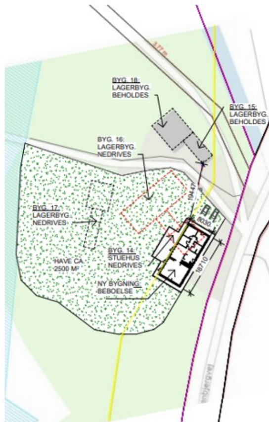
Bygningsændringer og udlæg af haveareal