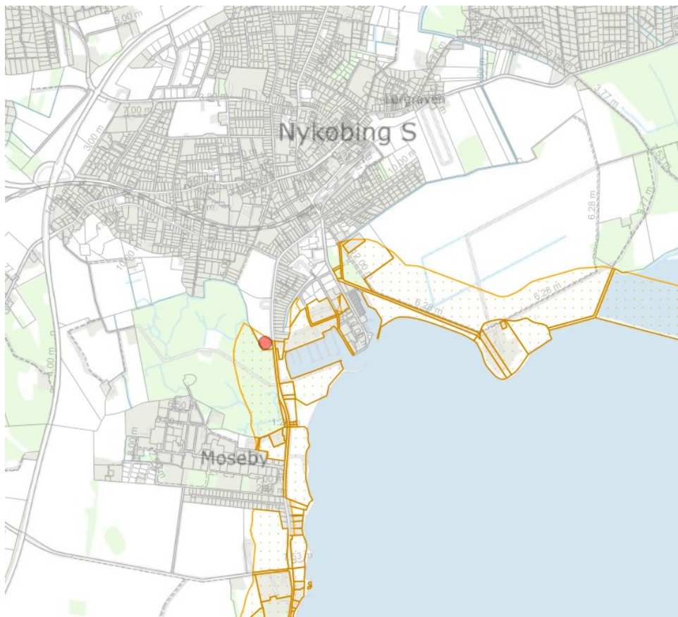
Figur 1. Oversigtskort. Den røde prik markerer arealet, hvor strandbeskyttelseslinjen ønskes ophævet. Orange signatur markerer strandbeskyttede arealer.