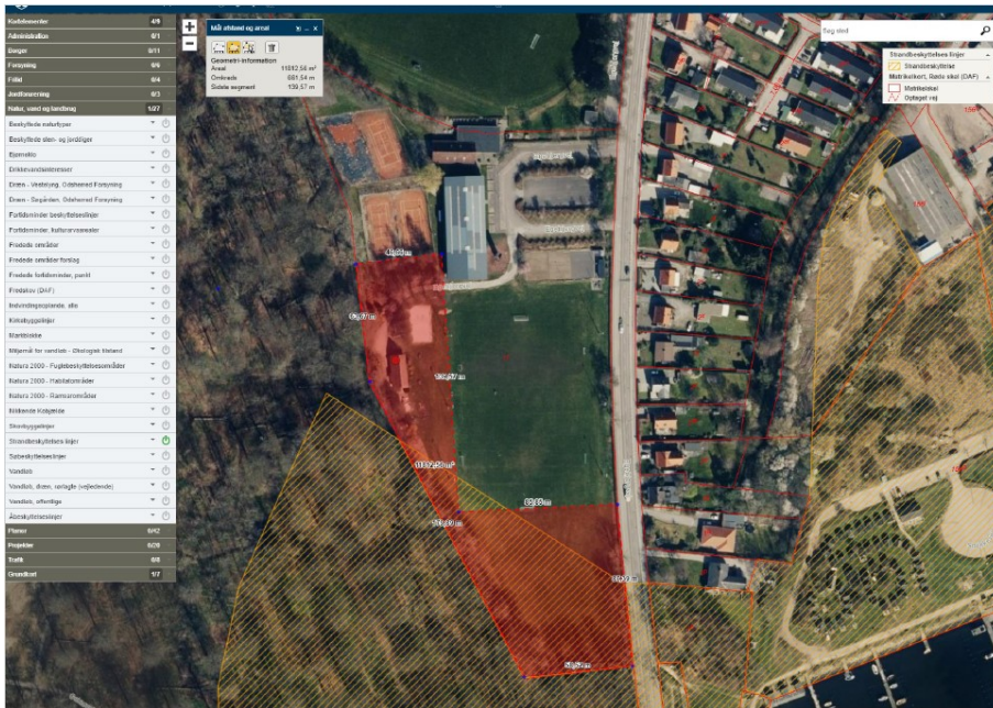
Figur 3. Kortbilag fra ansøgningen. Det røde markerede areal viser den påtænkte udstykning. Orange skravering viser strandbeskyttede arealer.