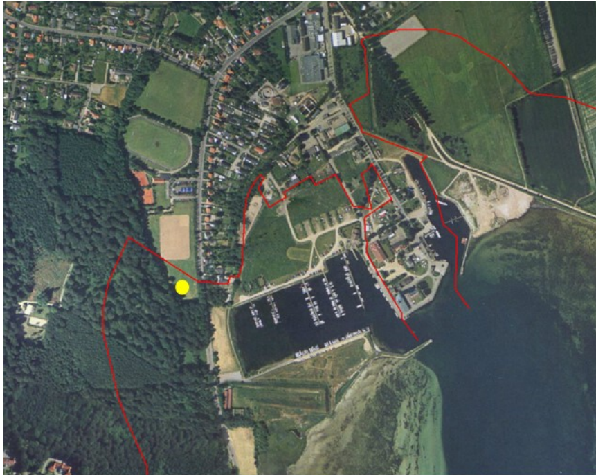
Figur 2. Luftfoto 1995. Den gule prik markerer arealet, som ansøgningen vedrører. Den røde linje viser strandbeskyttelseslinjen som fastlagt af Strandbeskyttelseskommissionen.

dokumenter i Strandbeskyttelseskommissionens arkiv, at kommissionen besigtigede området og i den forbindelse besluttede, at den anlagte sportsplads på den nordlige del af matr. nr. 1b Grønnehave, Nykøbing S. Jorder skulle undtages fra strandbeskyttelseslinjen, se figur 2.