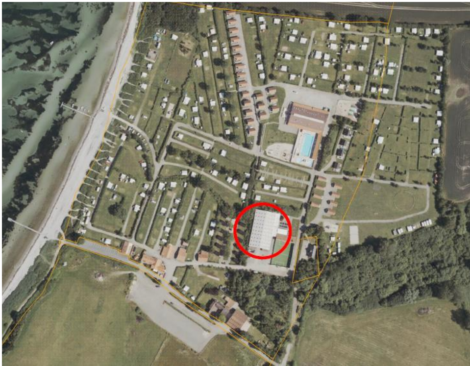
Fig. 2. Tilsendt fra ansøger. På figuren er bygningen, hvor solcellerne ansøges etableret, markeret med en rød cirkel.