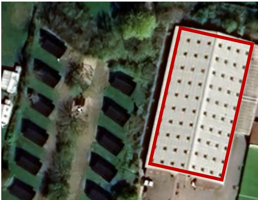
Fig. 3. Tilsendt fra ansøger. På figuren er den ansøgte placering af solcellerne markeret med en rød linje.