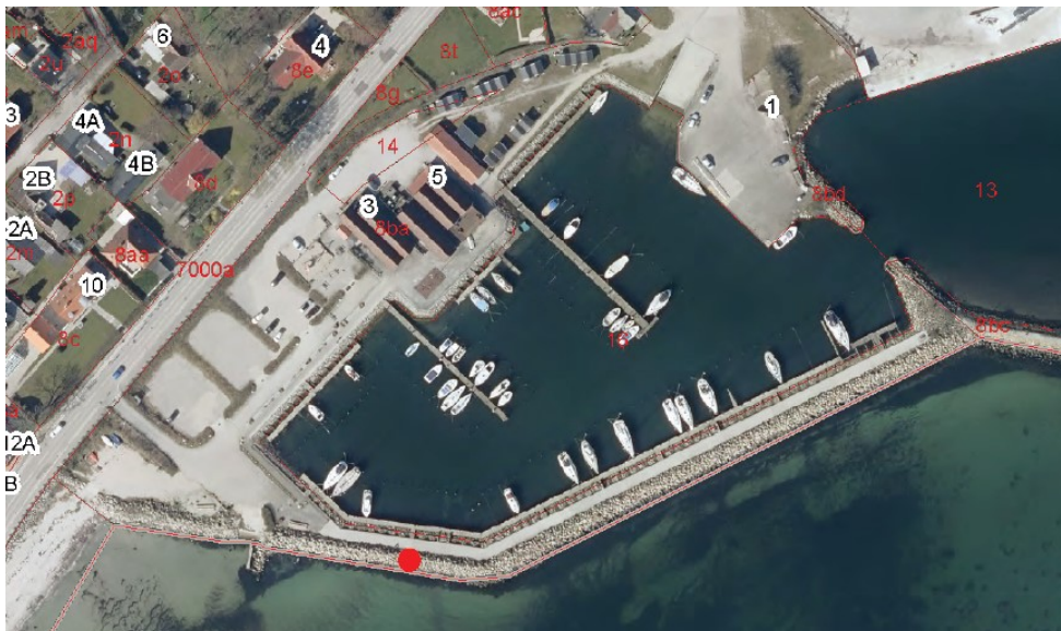
Fig. 3. Luftfoto med anlæggets placering markeret med en rød prik.

Anlægget etableres ved den sydlige dækmole på Faxe Ladeplads Lystbådehavn