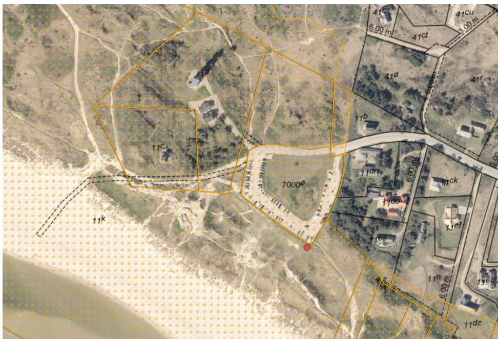
Figur 1. Ortofoto 2025. Den røde prik markerer matrikel 11k Vandflod By, Oksby samt den ca. placering af hjørnereflektoren. Det klitfredede areal er markeret med orange signatur. De sorte streger markerer de vejledende matrikelskel.

Der er ansøgt om opsætning af en hjørnereflektor på ovennævnte matrikel inden for klitfredningslinjen, se figur 1.