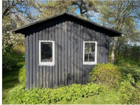
Facade mod syd