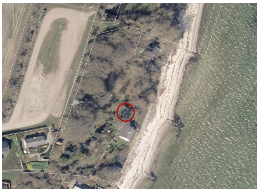
Fig. 2. Luftfoto fra foråret 2025 hvorpå eksisterende udhus er markeret med rød cirkel.