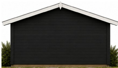
Facade mod vest