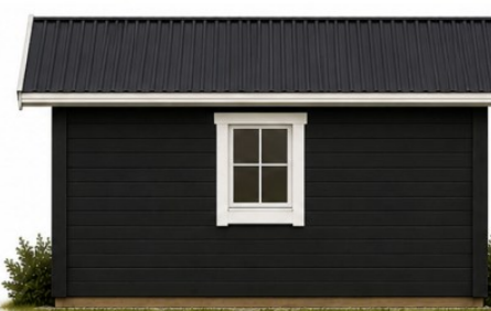
Facade mod nord