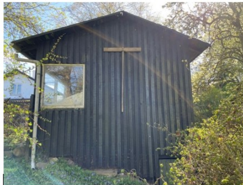
Fig. 4. Facade- og gavl billeder af ejendommens eksisterende udhus.