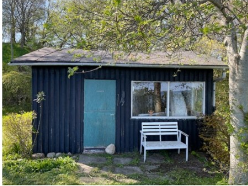
Facade mod øst (mod kysten)