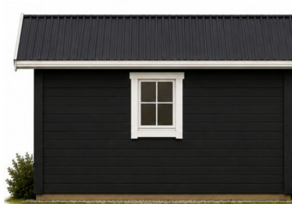
Facade mod syd