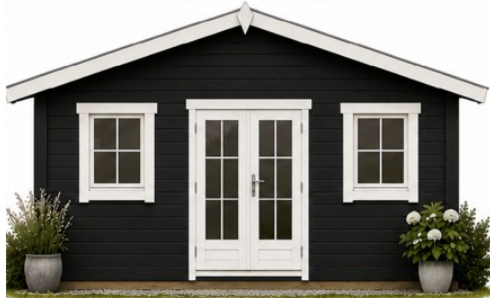
Facade mod øst (mod kysten)