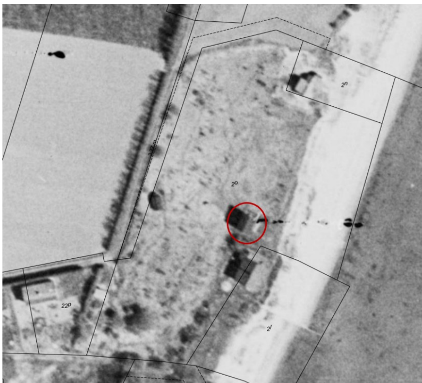
Fig. 3. Luftfoto af ejendommen fra 1954 hvorpå det eksisterende udhus på ejendommen er markeret med rød cirkel.

Det nye udhus vil måle 4 x 5 meter, hvorfor det vil opføres med et areal på 20 m 2 ligesom det eksisterende hus. Ligeledes vil det opføres med en højde tilsvarende det eksisterende udhus.