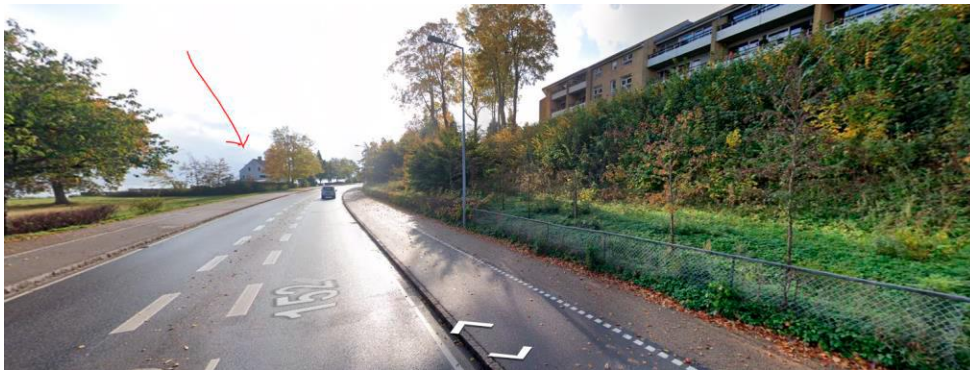
Boligens placering i kystlandskabet