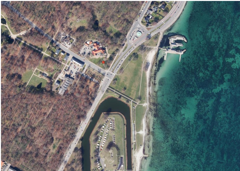
Luftfoto af området. Arrangementet afholdes på græsplænen ved den røde prik. Mod øst og syd ses Strandvejen, mod syd Charlottenlund Fort og mod nordøst Café Jorden rundt og Charlottenlund Søbad.