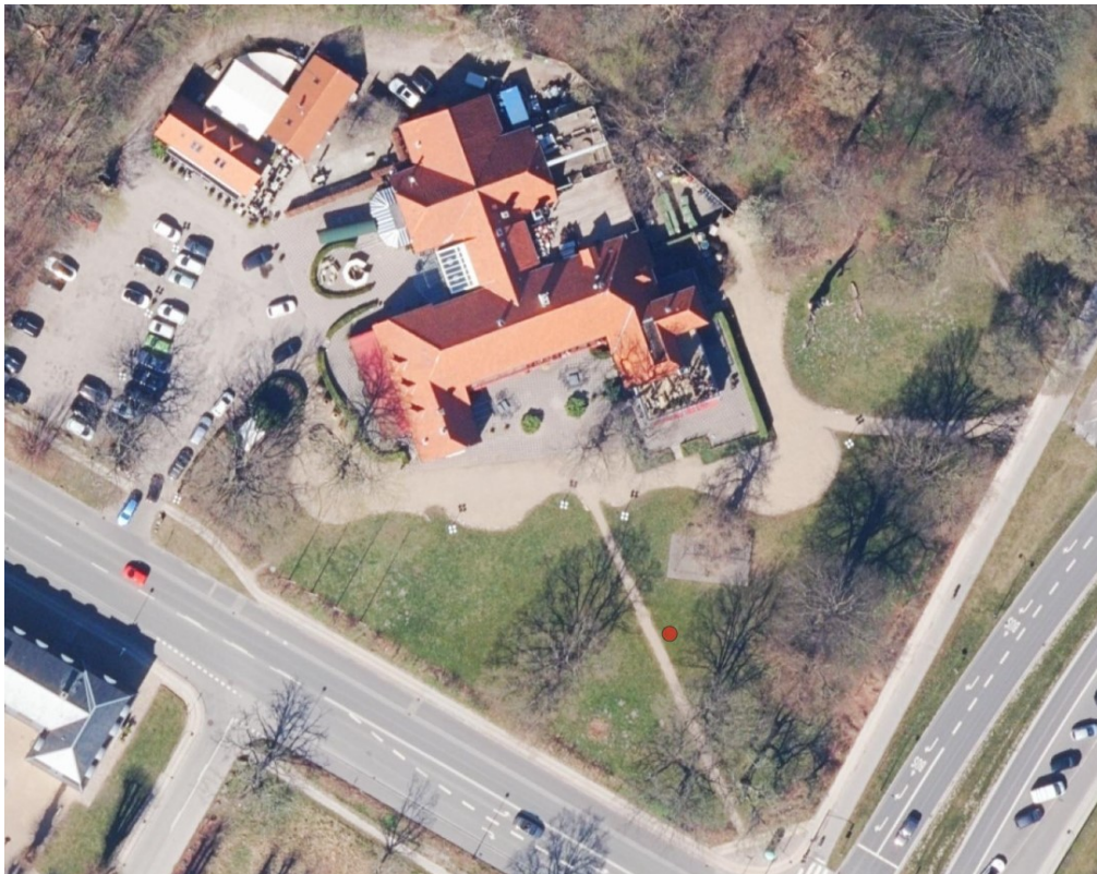
Luftfoto viser Skovriderkroen og projektområdet umiddelbart syd herfor.