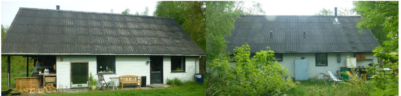
Fig. 2. Billeder indsendt af ansøger, som viser sommerhusets nuværende facader mod sydøst (billedet til venstre) og mod nordvest (billedet til højre).