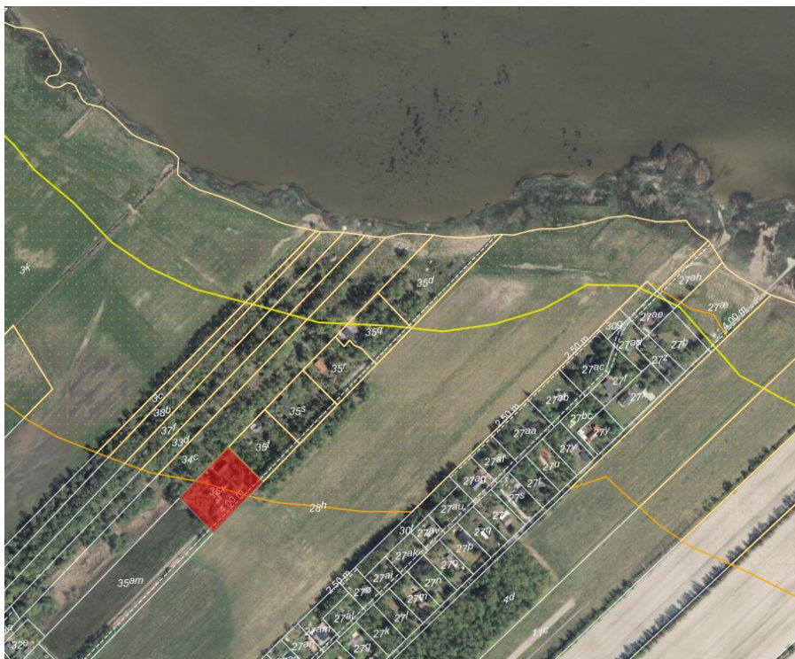
Fig. 1. Ortofoto fra foråret 2024. Det orange, prikkede område markerer det strandbeskyttede areal. Den orange linje viser den udvidede 300-meter-strandbeskyttelseslinje og den gule linje viser den oprindelige 100-meter-strandbeskyttelseslinje. De hvide streger markerer de vejledende matrikelskel. Den ansøgte ejendom er markeret med rød.

Kystdirektoratet har vurderet, at selve udskiftningen af ejendommens vinduer er omfattet af undtagelsesbestemmelsen i naturbeskyttelseslovens § 15a, stk. 1, nr. 5, som omhandler mindre vedligeholdelsesarbejder på bygninger inden for strandbeskyttelseslinjen. Af denne bestemmelse fremgår det, at en udskiftning af vinduer i eksisterende vindueshuller er undtaget fra forbuddet mod tilstandsændringer. Dispensationen meddelt i denne afgørelse vedrører således kun den ansøgte udvidelse af vinduesarealet.