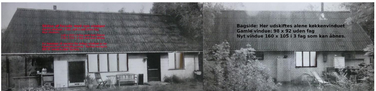
Fig. 3. Billede indsendt af ansøger, som viser de ønskede/ansøgte facader med de udvidede vinduer.