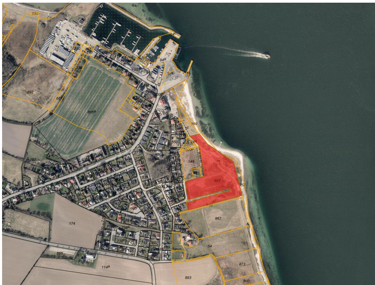
Fig. 1. Ortofoto 2026. Det strandbeskyttede areal er markeret med orange signatur. De sorte streger markerer de vejledende matrikelskel. Det røde område markerer den ansøgte matrikel.

En illustration af de ansøgte bomme ses på figur 3.