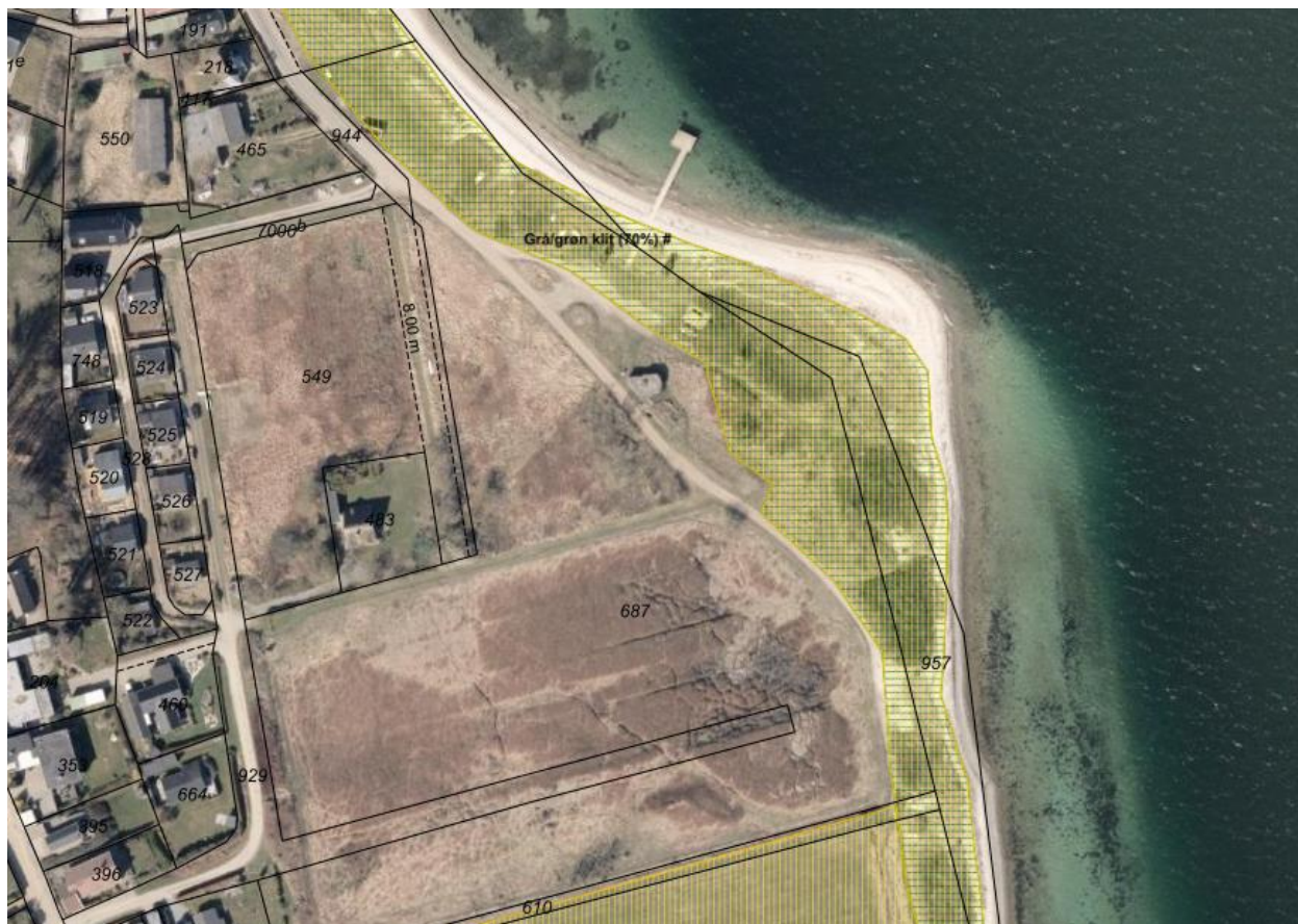
Fig. 4. Ortofoto 2025. På figuren markerer den gule lodrette skravering på den ansøgte matrikel grå/grøn klit (2130) i moderat tilstand, mens den grønne vandrette skravering markerer hvid klit (2120) i god tilstand.

Det fremgår i Natura 2000-planen for Natura 2000-område nr. 112, at den moderate tilstand af bl.a. grå/grøn klit primært skyldes invasive arter og vedplanter. I besigtigelsesnotatet udarbejdet af Miljøstyrelsen i forbindelse med kortlægningen af habitatnaturtypen i det ansøgte område fremgår det, at ca. 25-50% af arealet er tilgroet med rynket rose.