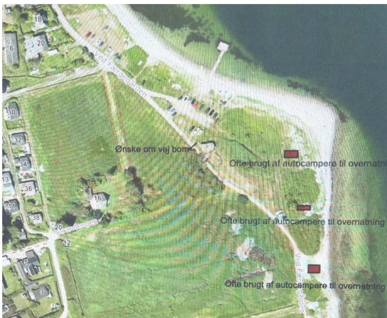
Fig. 2. Tilsendt fra ansøger. På figuren er den ansøgte placering af bommene markeret med en sort streg og teksten 'Ønske om vej bom' umiddelbart nordvest for bunkerens.