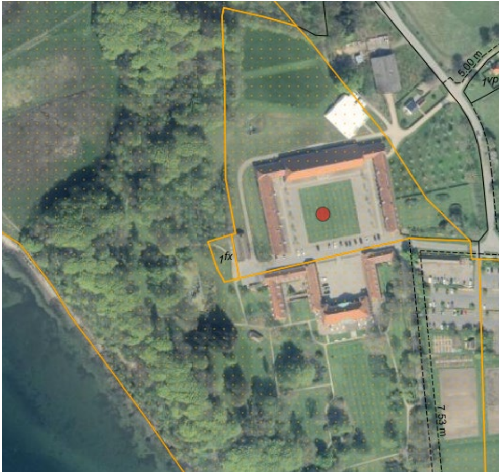
Luftfoto af området. Projektområdet er markeret med rød prik. Strandbeskyttelseslinjen er vist med orange signatur.