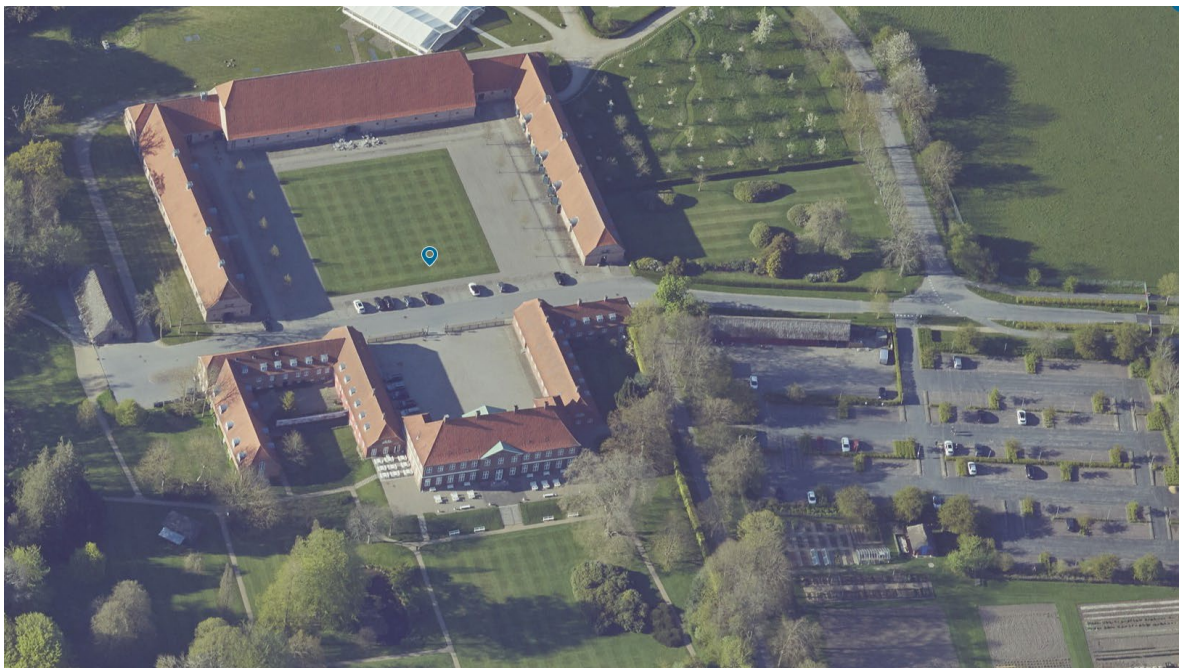
Luftfoto af området.