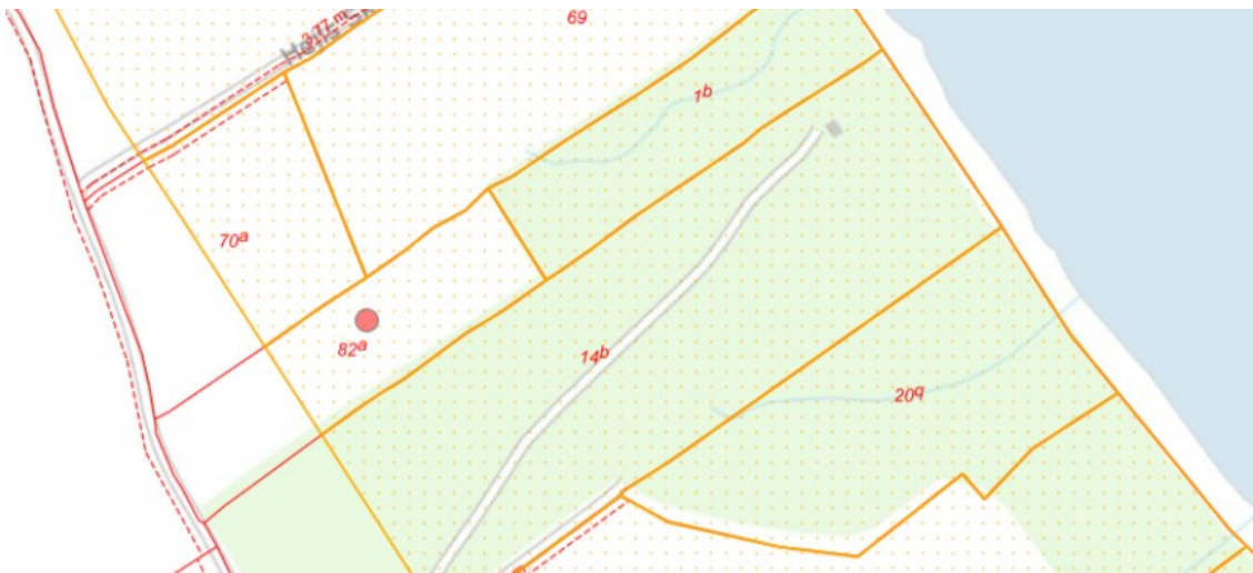
Fig. 1. Kort hvor det strandbeskyttede areal er markeret med orange signatur. De røde streger markerer de vejledende matrikelskel. Den røde prik markerer matrikel hvor skovrejsning ønskes.

På figur 3 er et oversigtskort over den ansøgte skovrejsning.