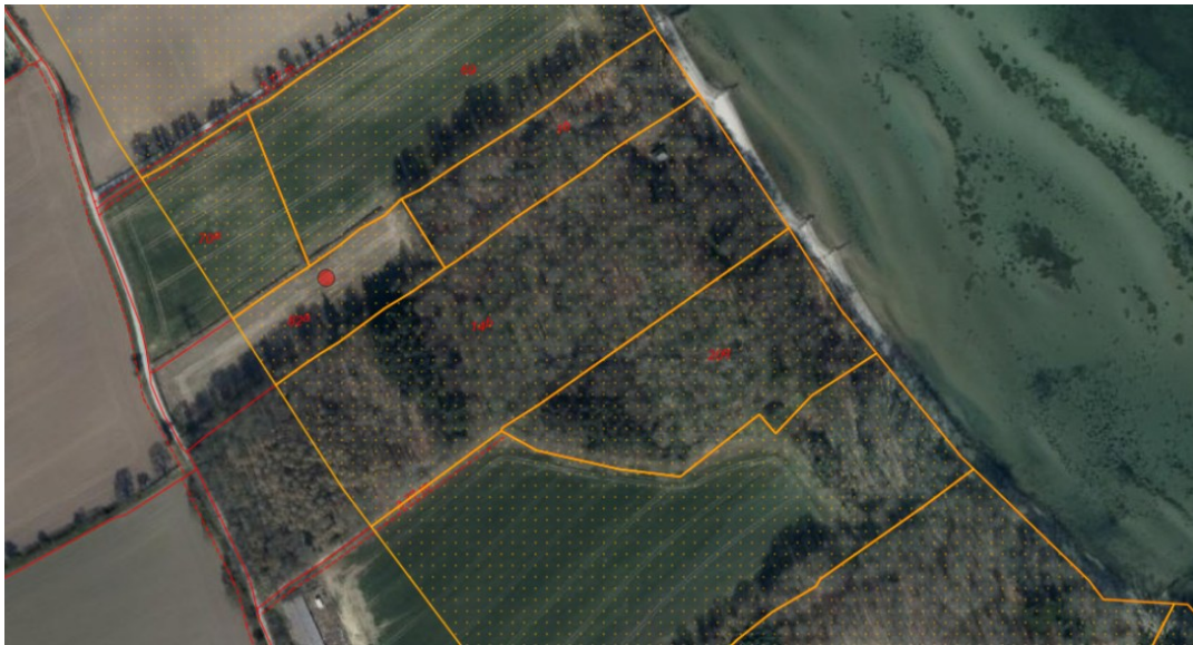
Fig. 2. Ortofoto 2025. Det strandbeskyttede areal er markeret med orange signatur. De røde streger markerer de vejledende matrikelskel. Den røde prik markerer den ansøgte matrikel.