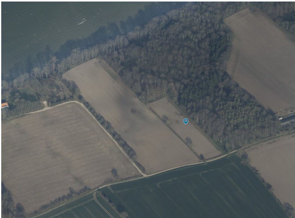
Fig. 4. Skråfoto fra 2023. Den blå prik markerer matriklen hvor skovrejsningen ønskes.

På figur 4 er et skråfoto fra 2023 hvor man ser området hvor den ansøgte skovrejsning ønskes placeret. Matriklen hvor der ansøges om skovrejsning er markeret med en blå prik. Det bevoksede areal søværts og bagved den ansøgte skovrejsning er registeret som fredskov.