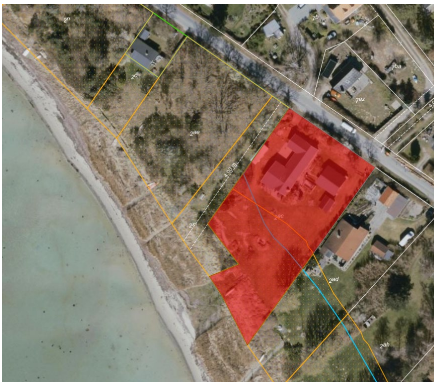
Fig. 1. Ortofoto af ejendommen fra foråret 2025. Den blå linje markerer den oprindelige 100-meter-strandbeskyttelseslinjen, mens den orange linje markerer den udvidede 300-meter-strandbeskyttelseslinje. Strandbeskyttelseslinjen er reduceret på den pågældende strækning. De umatrikulerede arealer ud til kysten samt stranden er også omfattet af bestemmelserne om strandbeskyttelse. De hvide streger markerer de vejledende matrikelskel. Den ansøgte matrikel er markeret med rødt.