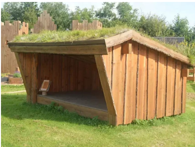
Fig. 3. Billede indsendt af ansøger, som viser den type shelter, der ønskes opført på arealet.