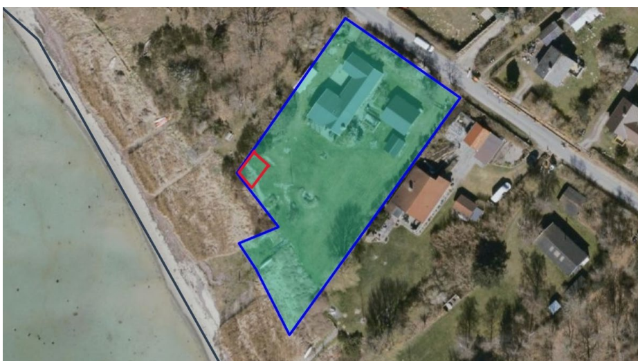
Fig. 2. Kort over ejendommen indsendt af ansøger, hvorpå den ønskede placering af shelteret er markeret med rød firkant.