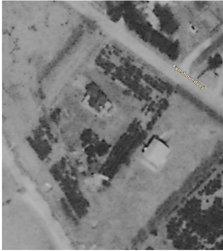
Fig. 5. Ortofoto af ejendommen fra 1963-1965, hvorpå arealet omkring sommerhuset formentlig er blevet taget i brug som have.