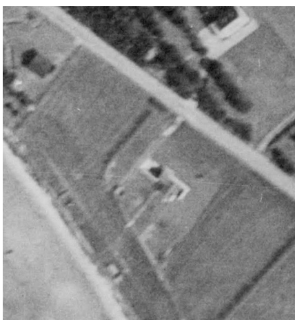
Fig. 4. Ortofoto af ejendommen fra 1954, hvorpå arealerne rundt om sommerhuset ses at være drevet landbrugsmæssigt.

På baggrund af Kystdirektoratets gennemgang af luftfotos af ejendommen fra 1954 og frem til i dag kan det udledes, at udendørsarealerne omkring sommerhuset tidligere har været drevet landbrugsmæssigt, men at arealerne senere er blevet udstykket til sommerhuse. Fra 1963-1965 ses størstedelen af arealet rundt om sommerhuset at have karakter af have, hvorfor Kystdirektoratet vurderer, at arealet fra omkring dette tidspunkt var blevet taget i brug som have. Det fremgår af senere ortofotos, at arealet også efterfølgende kontinuerligt har været anvendt som have frem til i dag. Størstedelen af matriklens udendørsareal vurderes på den baggrund at være lovligt etableret have i henhold til naturbeskyttelsesloven (se fig. 6).