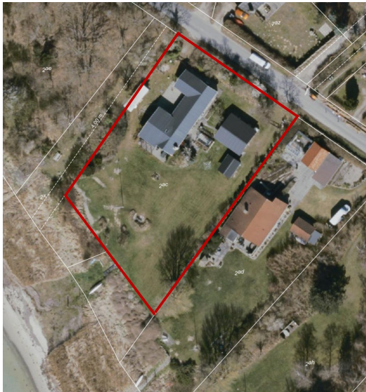
Fig. 6. Ortofoto af ejendommen fra foråret 2025, hvorpå det areal, der vurderes at være ejendommens lovligt etablerede have, er indtegnet med rødt.