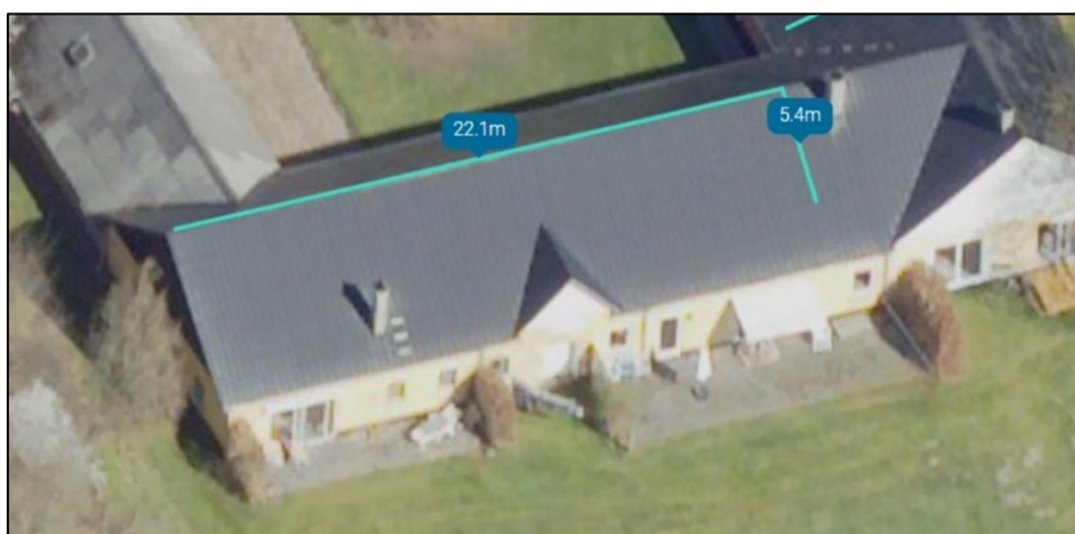
Fig. 3. Tilsendt af ansøger. Foto af tagfladen, hvor der ansøges om opsætning af solceller.