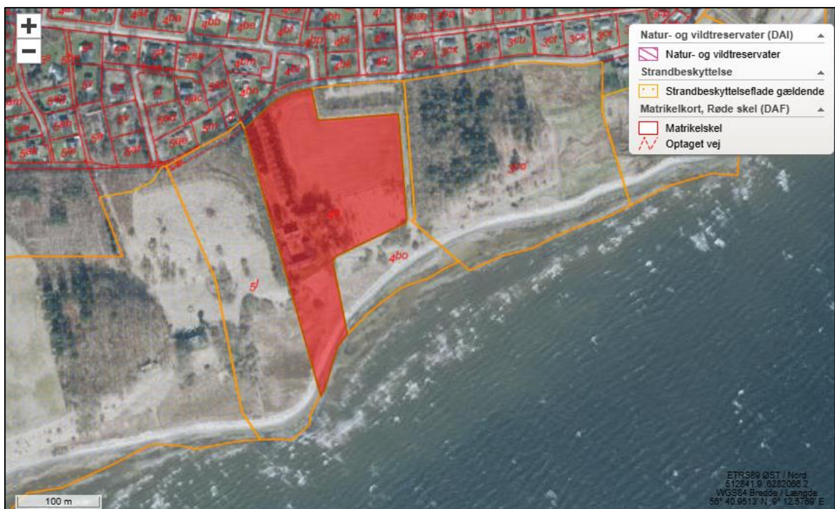
Fig. 1. Ortofoto 2025. Det strandbeskyttede areal er markeret med orange signatur. De røde streger markerer de vejledende matrikelskel. Den ansøgte matrikel er markeret med rød farve.

Et billede af bygningen taget fra vandet ses på figur 4.