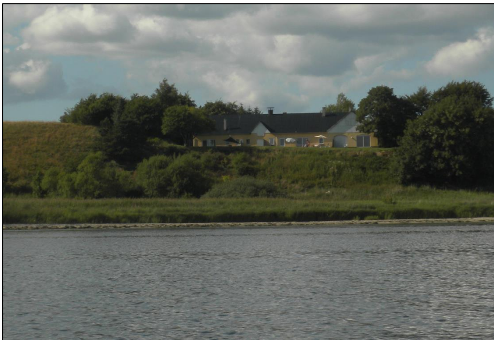
Fig. 4. Foto fra vandet med udsigt mod bygningen.