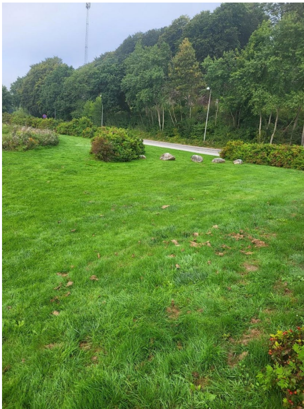
Figur 6. Billede af arealet, taget d. 8. september 2023.