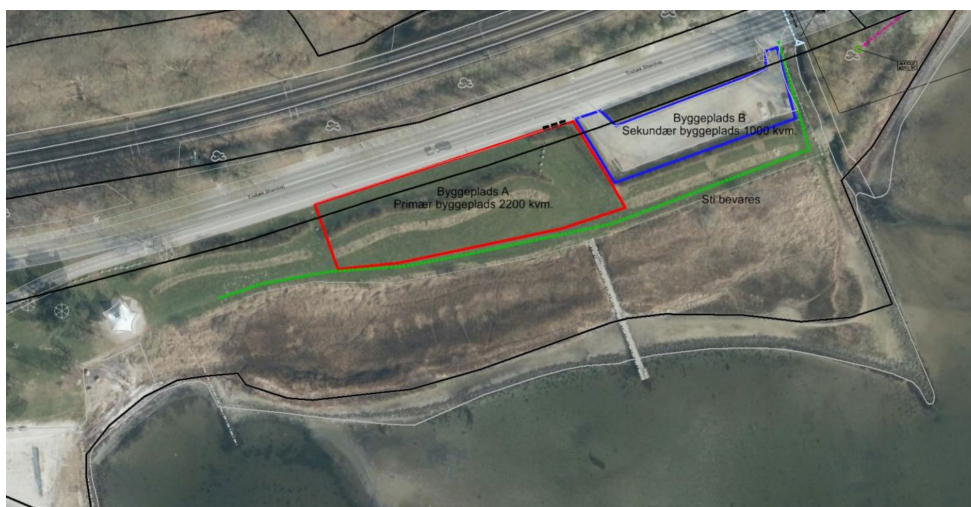
Figur 4. Placering af jorddepot ved Albuen.

Medmindre andet fremgår af tilladelsen, vil arealerne blive reetableret til samme stand, som inden depotet blev etableret.