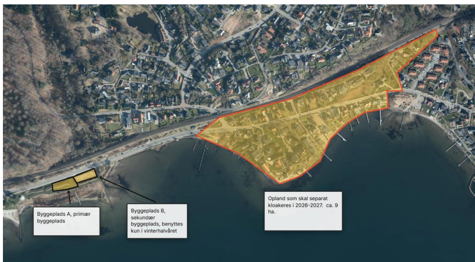
Figur 2. Projektområde hvor separeringen udføres.

Med baggrund i tillæg 232 og 27 til Vejle Kommunes Spildevandsplan, skal Vejle Spildevand separere hele Bredballe, over en længere årrække. I 2026 – 2027 skal et område langs med Strandvejen separatkloakeres, for at reducere overløb til Vejle Fjord. Det forventes at overløbsmængden reduceres med ca. 14.000 m 3 /år. I projektet flyttes også en gammel pumpestation, som i dag er i risiko for at blive oversvømmet i forbindelse med en eventuel stormflod, samt en generel modernisering af kritisk infrastruktur i oplandet. Området er tæt bebygget og det er derfor meget udfordrende at finde de nødvendige arealer til byggeplads. Af figur 2 fremgår oplandet som separatkloakeres, samt beliggenheden af den ønskede byggeplads.