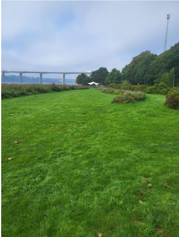
Figur 5. Billede af arealet, taget d. 8. september 2023.