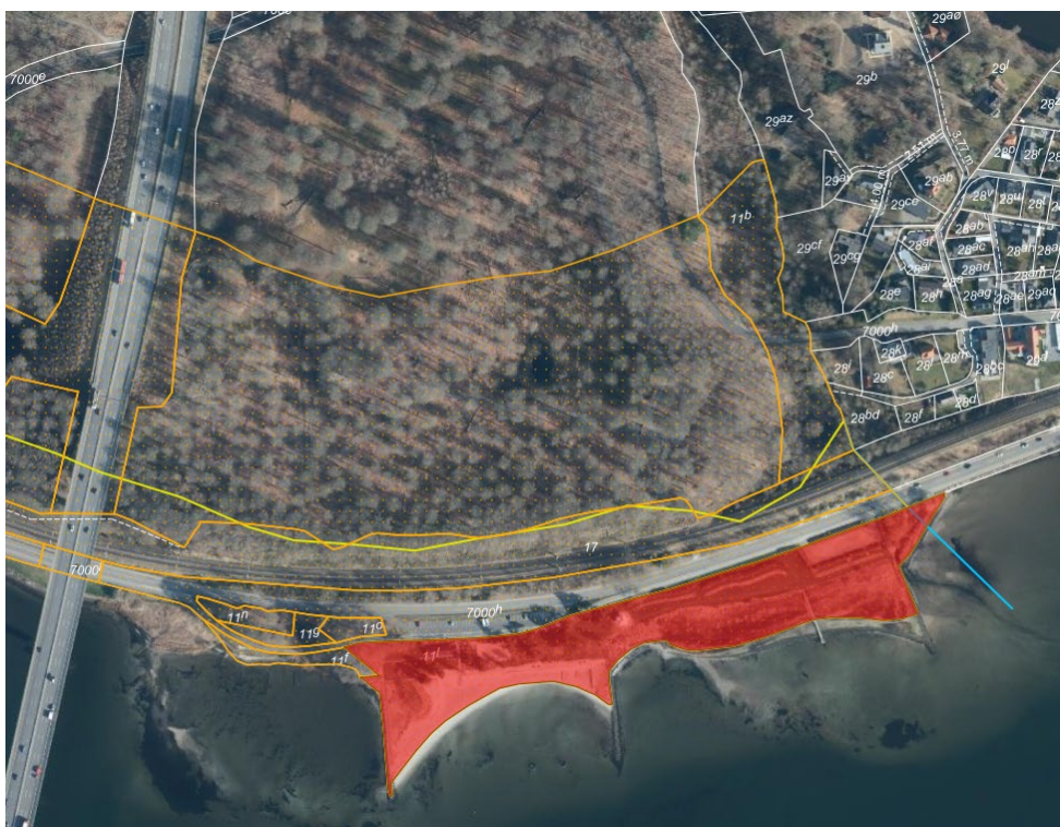
Fig. 1. Ortofoto af ejendommen fra foråret 2025. Den gule linje viser den oprindelige 100-meter strandbeskyttelseslinje, mens den orange linje viser den udvidede 300-meter strandbeskyttelseslinje. De hvide streger markerer de vejledende matrikelskel.

I nærværende sag har virksomheden, Vejle Spildevand A/S, ansøgt Kystdirektoratet om dispensation til både at anvende p-pladsen og en del af græsarealet vest for p-pladsen til jorddepot. Arealet ønskes anvendt som jorddepot og oplagsplads i en periode på omkring to år fra 15. september 2026 til august 2028, hvor kloakeringsarbejdet forventes at stå på.