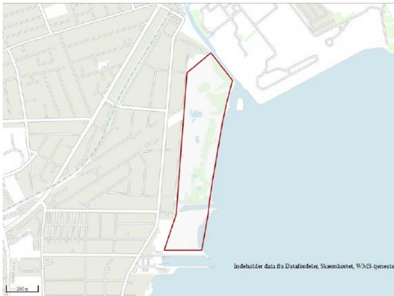
Fig. 2. Kort vedhæftet ansøgningen