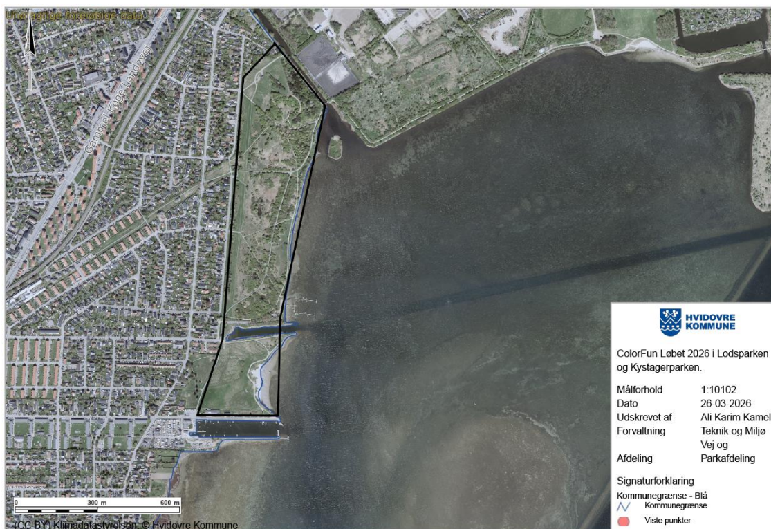
Fig. 4. Kort vedhæftet ansøgningen.

Den ansøgte placering ligger inden for et fredet område. Afgørelsen videresendes af den grund til Fredningsnævnet for København til orientering.