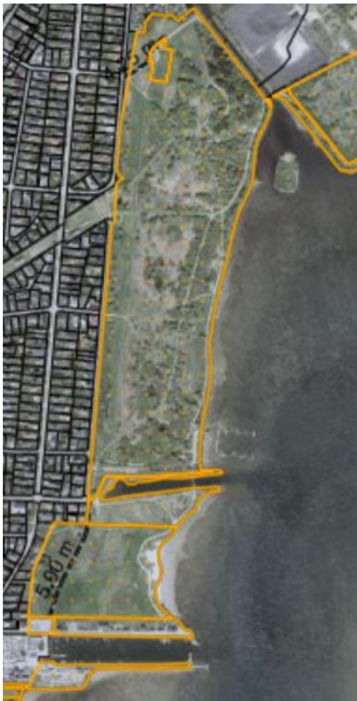
Fig. 1. Ortofoto 2025. Det strandbeskyttede areal er markeret med orange signatur. De sorte streger markerer de vejledende matrikelskel.

Arrangementet afvikles den 29. august 2026 fra kl. 06.00 til 23.00. Der er behov for opsætning og nedtagning i perioden fra den 28. august 2026 til den 30. august 2026.