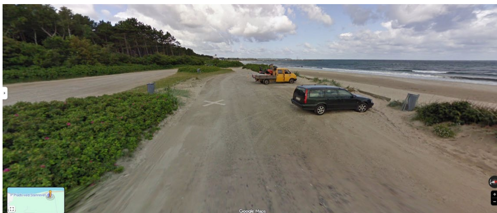
Foto af området fra terræn. Indsendt af ansøger.