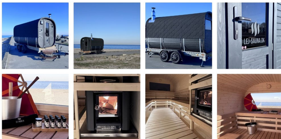
Eksempelfotos. Indsendt af ansøger.

Ejendommen er ejet af Naturstyrelsen, der modtager denne afgørelse til orientering.