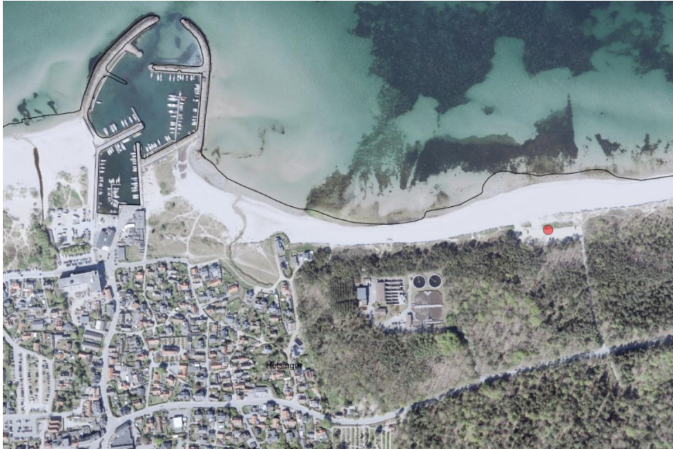
Luftfoto af området. Mod vest ses Hornbæk og Hornbæk Havn. Projektområdet er markeret med rød prik.