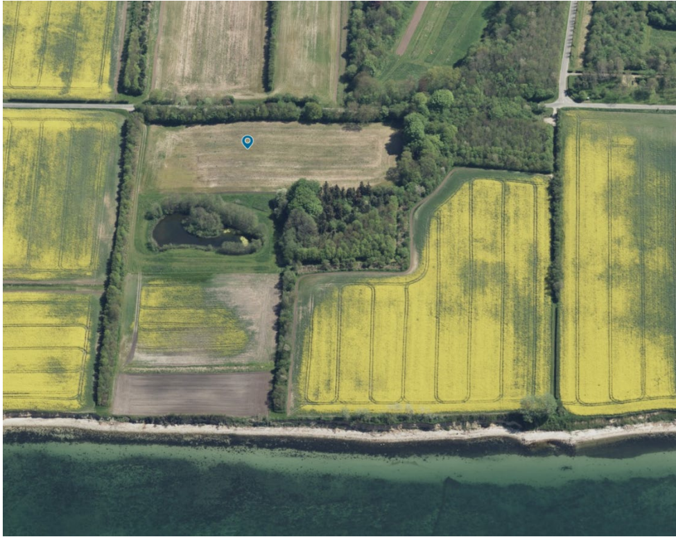
Figur 5. Skråfoto fra 2023. Den blå markør markerer arealet, hvor det ønskes at rejse skov.