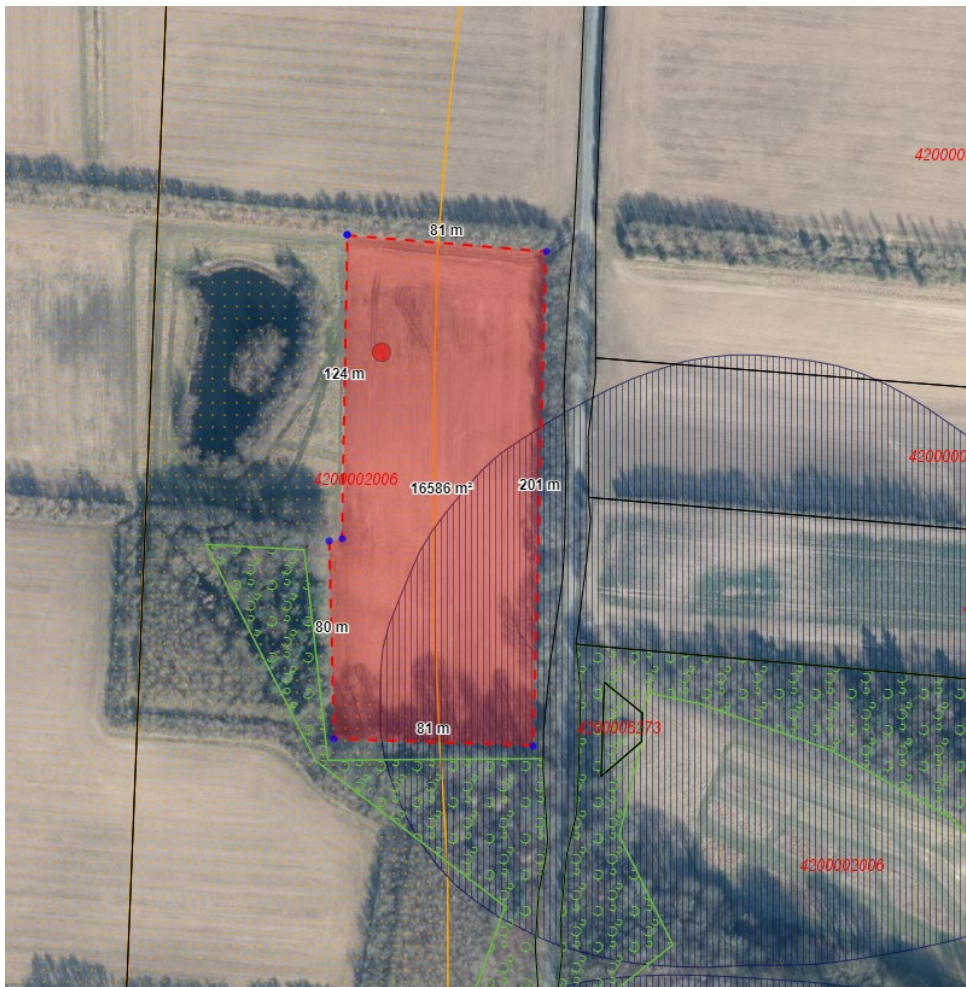
Figur 4. Kortbilag fra ansøgningen, der viser arealet på skovrejsningen samt eksisterende arealer med fredskov.

Af figur 5, ses matriklen fra kysten af, via skråfoto, mens figur 6, 7 og 8 er fra street view hvor man står på vejen der løber øst for det ansøgte område.