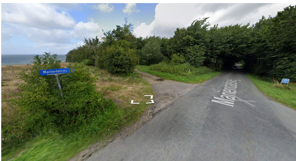
Figur 8. Foto fra street view, hvor man ser arealet hvor det ønskes at rejse skov fra vejen og mod nordvest.

Derudover oplyses det i ansøgningen at plantesammensætningen vil følge retningslinjerne for Landbrugsstyrelsens skovrejsningsordning.