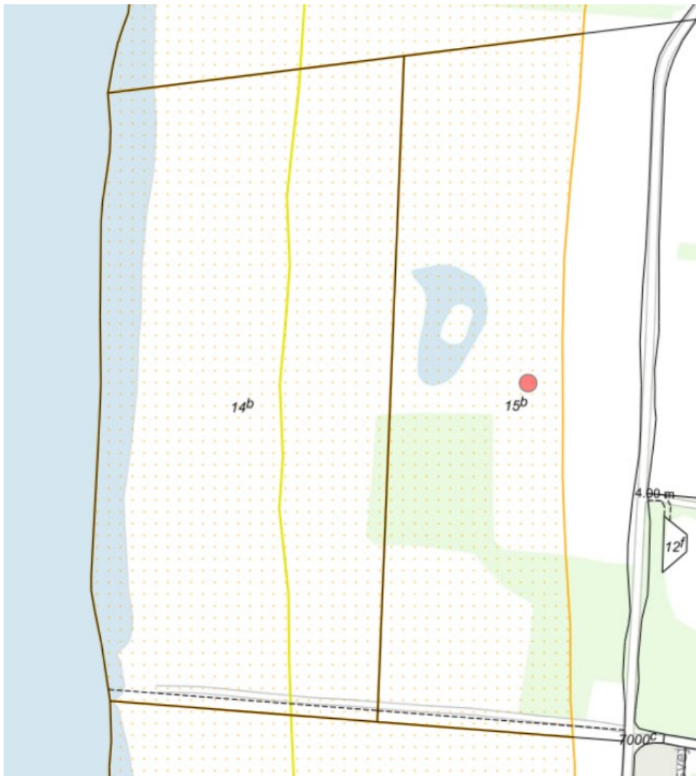
Fig. 1. Kortudsnit. Den røde prik markerer matriklen hvor der ønskes at foretage skovrejsning. Det orange prikkede område markerer det strandbeskyttede areal. Den gule streg markerer den oprindelige 100 m strandbeskyttelseslinje. De sorte streger markerer de vejledende matrikelskel.

Ejendommen er i BBR noteret som landbrug og er delvis omfattet af den udvidede strandbeskyttelseslinje. Se figur 1 og 2.