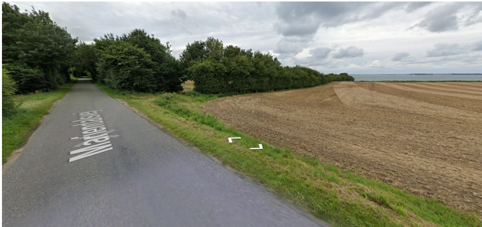
Figur 6. Foto fra street view, hvor man ser arealet hvor det ønskes at rejse skov fra vejen og mod sydvest.