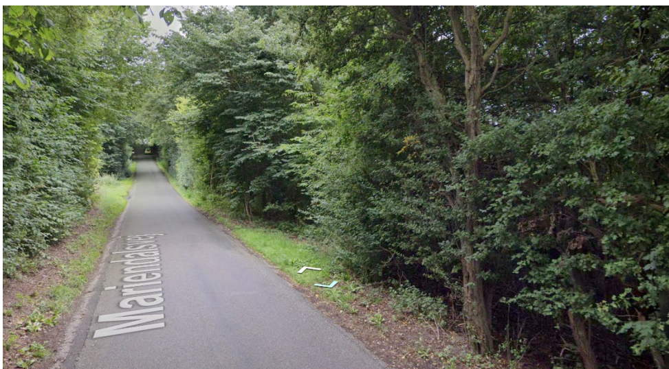
Figur 7. Foto fra street view, set fra vejen øst for projektet, hvor beplantningen langs vejens højre siden er ud mod området hvor der ønskes skovrejsning.