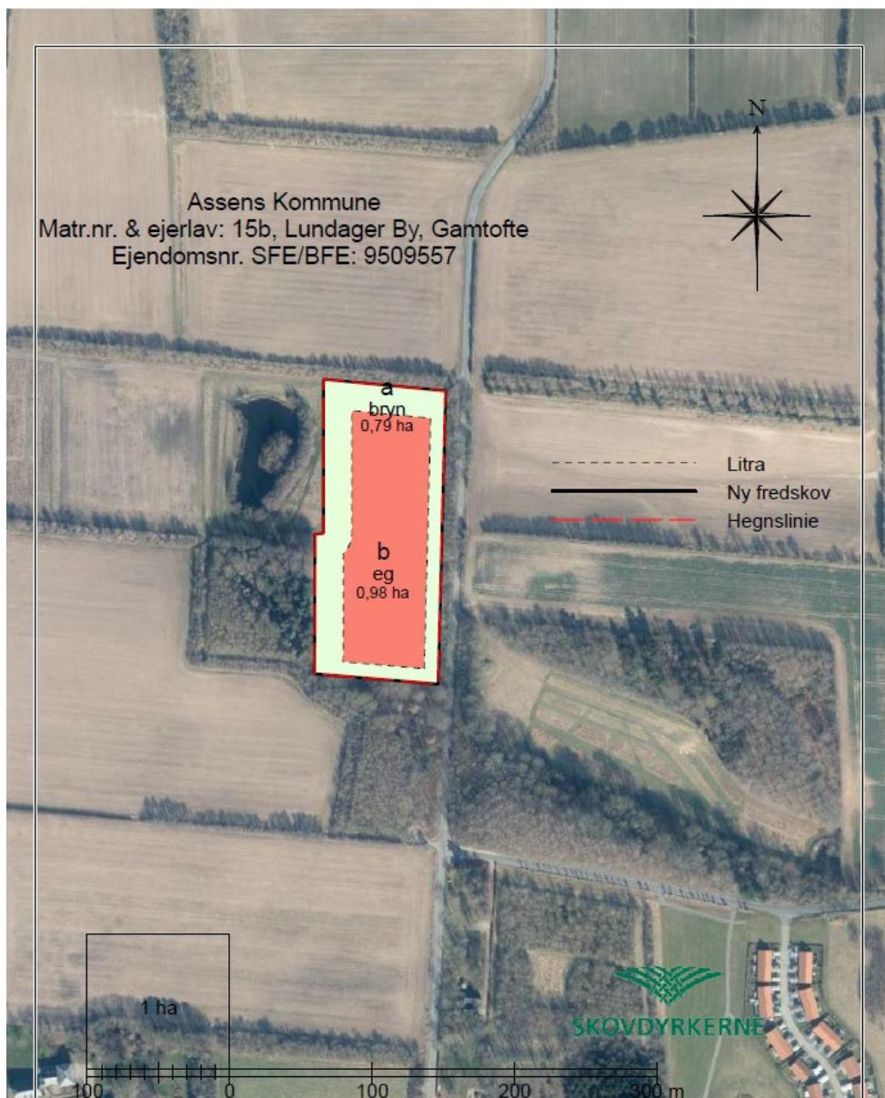
Fig. 3. Kortmateriale fra ansøgningen der viser placeringen af den ønskede skovrejsning.

Af ansøgningen fremgår det, at det er ønsket at tilplante ca. 1,7 ha med skov og at arealet der ønskes tilplante ligger i forlængelse af eksisterende fredskov. Se figur 4.