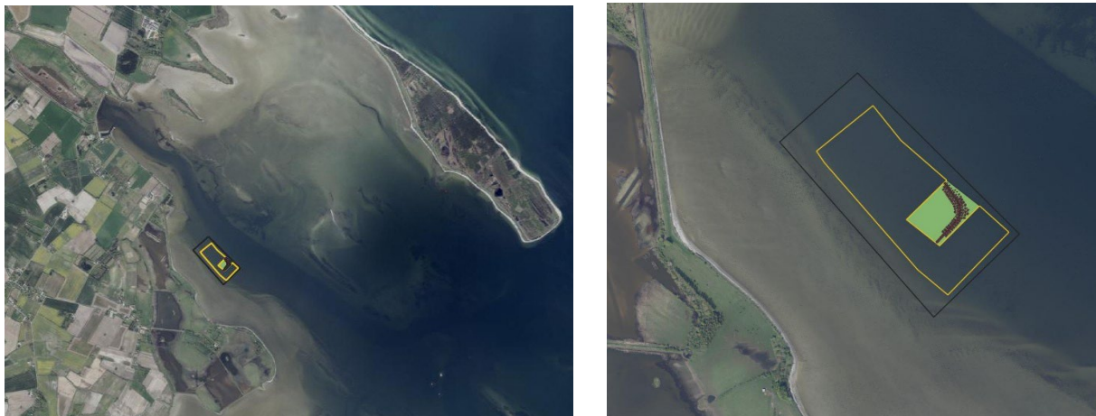
Figur 1. Til venstre: Egensedybet i Odense Fjord med angivelse af projektområdet ved Firtalsdæmningen hvor virkemidler ønskes placeret. Til højre: Detaljeret kort over virkemiddeldesign i området. Det sort-indrammede angiver det totale projektområde på 15,5 ha og det gult-indrammede viser den planlagte nye sandkappe. Det grønne felt viser en eksisterende sandkappe, som blev anlagt i 2018. De røde punkter viser placeringen af stenrevet, som blev etableret i 2024.

Der søges om tilladelse til at etablere sandkappen ud for Firtalsdæmningen i Egensedybet (Fig. 1)