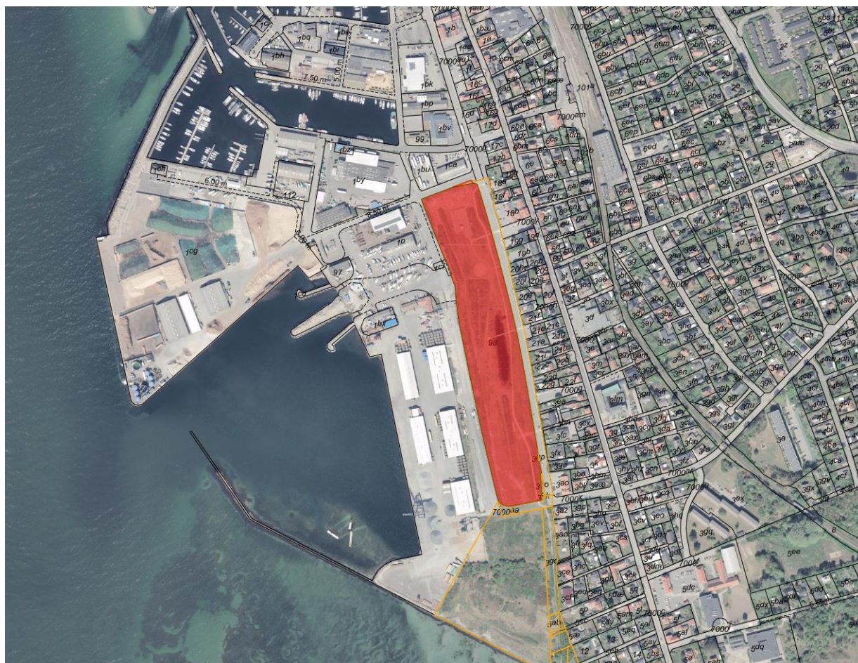
Fig. 1. Ortofoto 2025. Det strandbeskyttede areal er markeret med orange signatur. De sorte streger markerer de vejledende matrikelskel. Det røde område markerer matr.nr. 98 Hundested By, Torup. Den røde trekant i tilknytning hertil, mod nord, markerer det område af matr.nr. 7000p der ansøges anvendt.

En illustration af pladstegningen ses på figur 3.