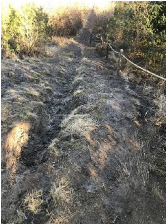
Fig. 4. Foto fra ansøgningen viser ansøgt placering af trappe A, på 18 m.