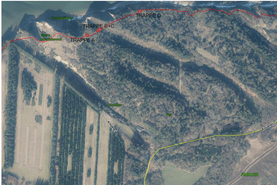
Fig. 2. Oversigtskort ansøgningen viser placeringen af de 4 ansøgte trapper.