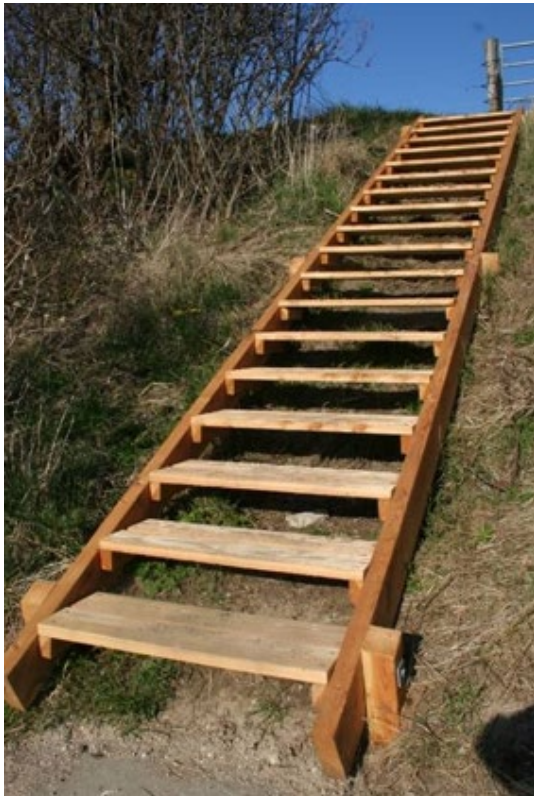
Fig. 3. Eksempel fra ansøgningen på en ansøgt trappe.