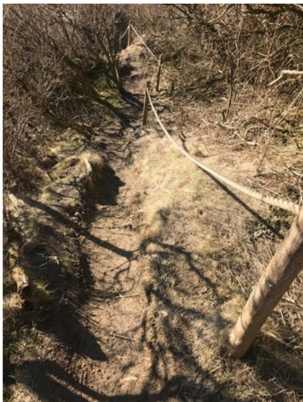
Fig. 5. Foto fra ansøgningen viser ansøgt placering af trappe B og C, 6 og 7 m. Der er et jævnt plateau på ca. 1,5 meter midtvejs på strækningen. Derfor deles trapperne op i to.