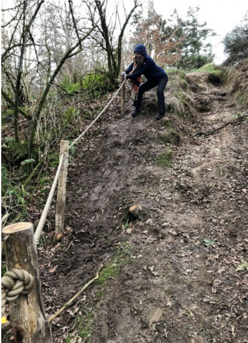
Fig. 6. Foto fra ansøgningen viser ansøgt placering af trappe D på 8 m.